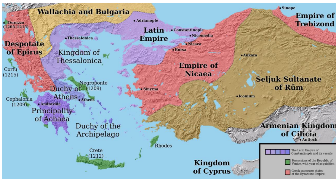
Figura 1: Bizanci després de la Quarta Croada. Font: Division of the Byzantine Empire, 1204 CE. (Illustration) - World History Encyclopedia

escollit emperador. Al seu torn, a la Grècia del nord i central s'institucionalitzaren principats territorials que retien vassallatge a l'emperador llatí: el regne de Tessalònica, el principat d'Acaia, al Peloponès i el ducat d'Atenes. Les capes del poder eclesiàstic es llatinitzaren, juraren lleialtat al Papa de Roma i s'implantà el sistema feudal importat d'Occident. De fet, s'ha parlat d'"expansió colonial" (Faci, 1996, 65).