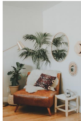
Imagen 15 Simulación habitación casa Noelina.