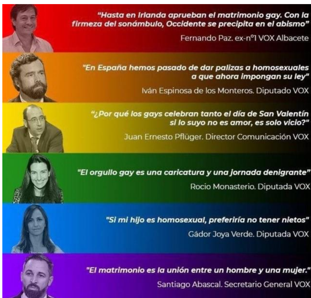
Imagen 8. Collage de frases dichas por dirigentes y diputados de VOX contra el colectivo LGTBI+.

Así pues, vemos que la ideología de Vox es clara. Quieren derogar las leyes que protegen los derechos del colectivo LGTBI, incluso volver a prohibir el matrimonio entre personas del mismo sexo. Fomentan el pensamiento de que en las escuelas no se puede enseñar que hay más relaciones aparte de las heterosexuales. Estos conceptos los hemos escuchado de la voz de los propios dirigentes del partido. El discurso que venden es el que se puede observar en la imagen siguiente: