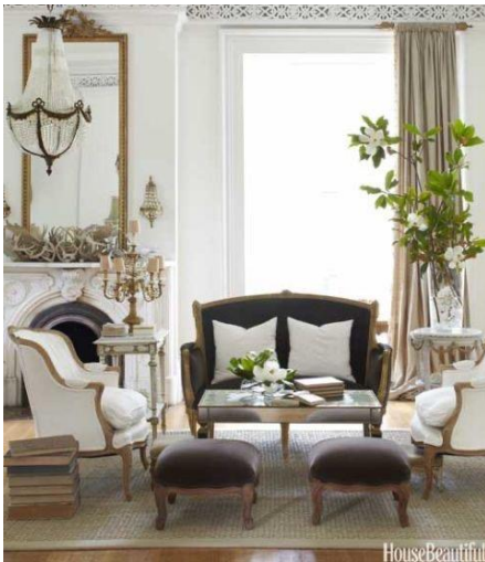
Imagen 14 Simulación habitación casa Paulina.