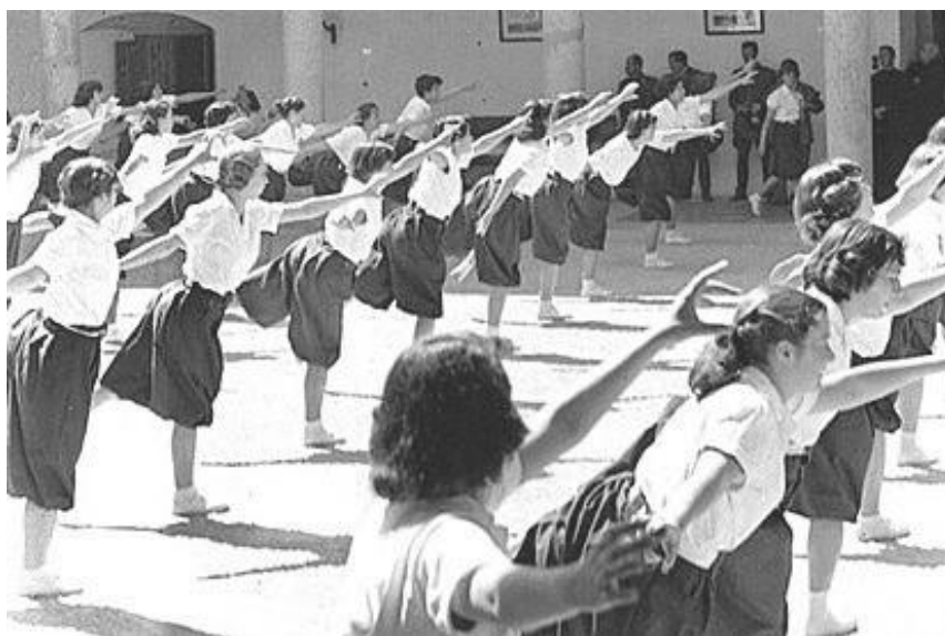
Imagen 2. Franco inaugura la escuela de instructoras de la sección femenina.

Para comprender cuál era la situación de las lesbianas en el franquismo debemos analizar primero cuál era el rol de la mujer. Durante la dictadura, existieron diversas organizaciones que oprimían a las mujeres. En 1934 nace la “La Sección Femenina” en Madrid, y en 1939, nace la “Acción Católica”, dos organizaciones que pretendían promover la imagen de mujer perfecta que el propio régimen buscaba, dentro de su ideología nacional católica 12 .