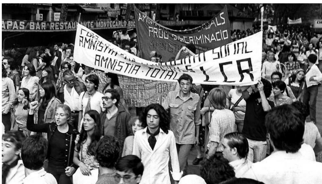
Imagen 4. Primera manifestación a favor de los derechos de los homosexuales del 26 de junio de 1977. Organizada por FAGC. Extraído de EFE. [Consulta: 3 de junio 2022]