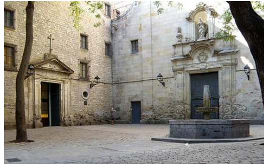
Imagen 13. Plaza Sant Felip Neri, Barcelona.