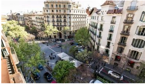
Imagen 12. Rambla de Catalunya, Barcelona.