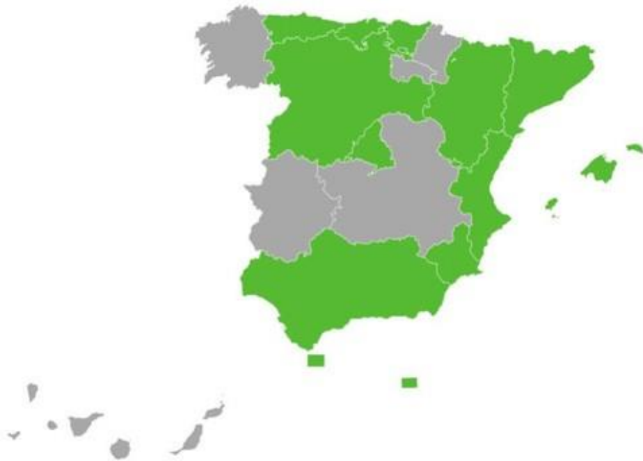
Imagen 7. Mapa de las Comunidades Autónomas con representación de Vox en los Parlamentos Regionales.

Fuente: Maldita.es [Consulta: 3 de junio 2022]