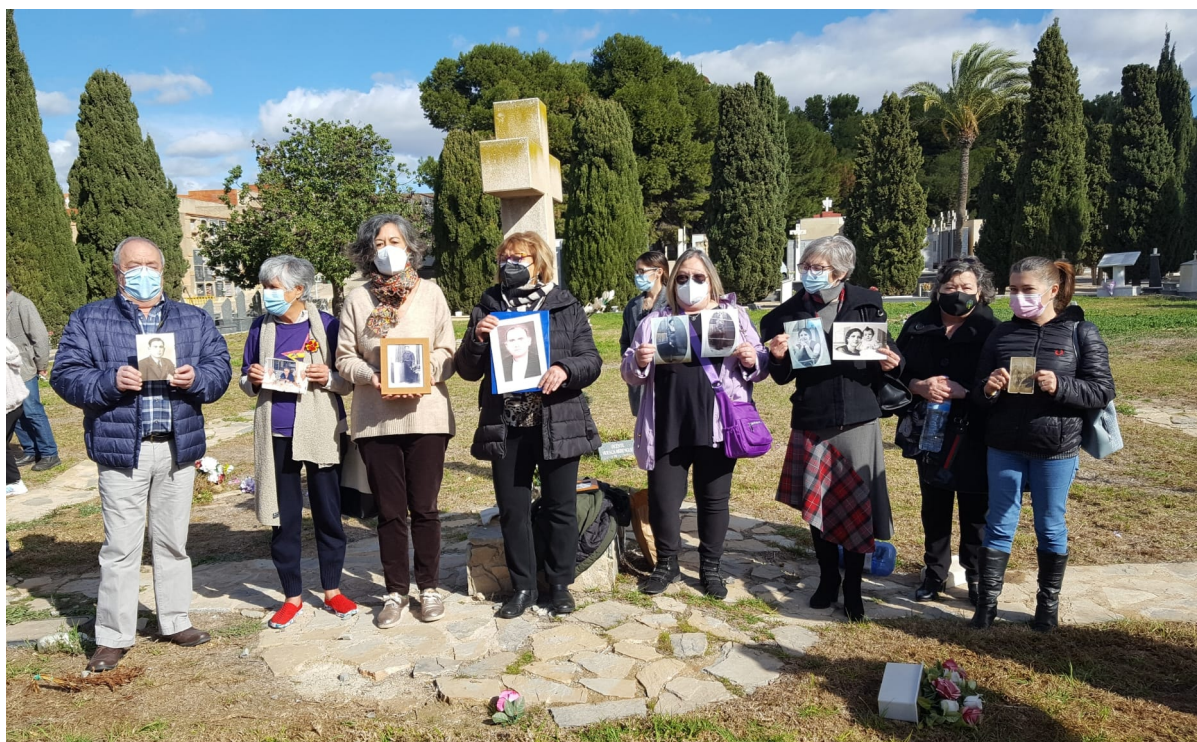
Membres de l'associació al Cementiri de la Mare de Déu del Remei.