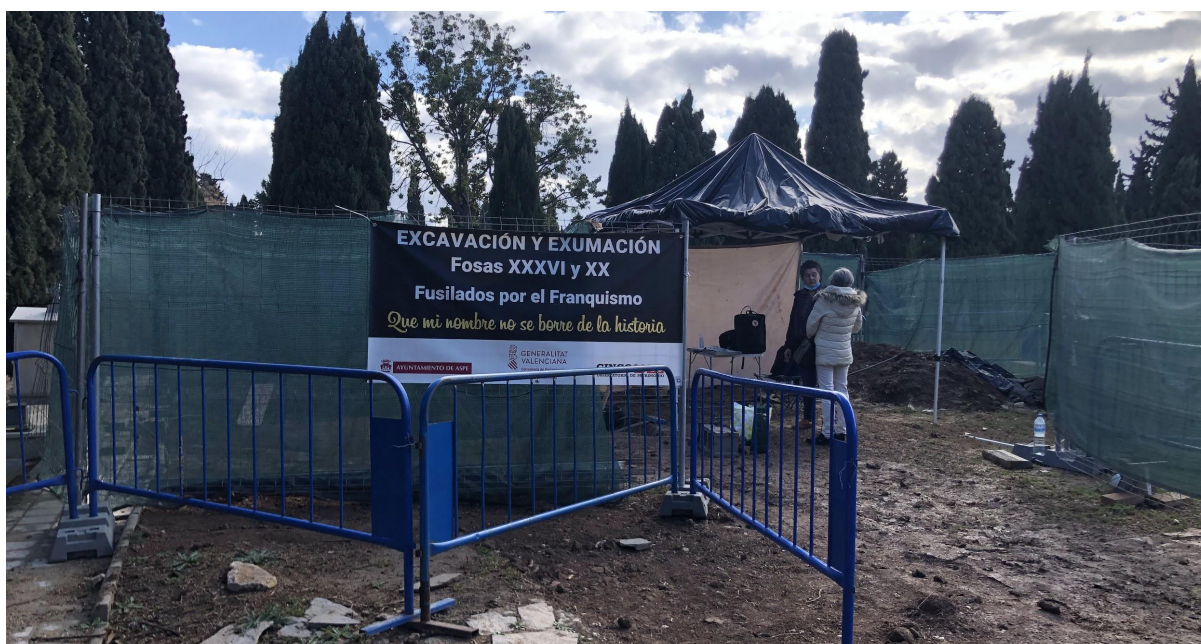
Treballs d'exhumació de la fossa XXXIII.

Un cop acabat el recorregut pels quadres 12 i 19, tornem a la zona on s'està exhumant la fossa XXXIII i deixo als arqueòlegs treballar. El matí al cementiri és tranquil. Malgrat que poc a poc va sortint el sol, un matí entre setmana no dona peu a què moltes persones puguin escapar-se de la rutina per visitar als seus difunts. Durant diverses hores estem sols, sota la carpa que protegeix els materials de l'exhumació, els arqueòlegs de Drakkar i jo. De tant en tant, però, passa alguna persona per davant buscant alguna làpida, portant flors o simplement passejant.