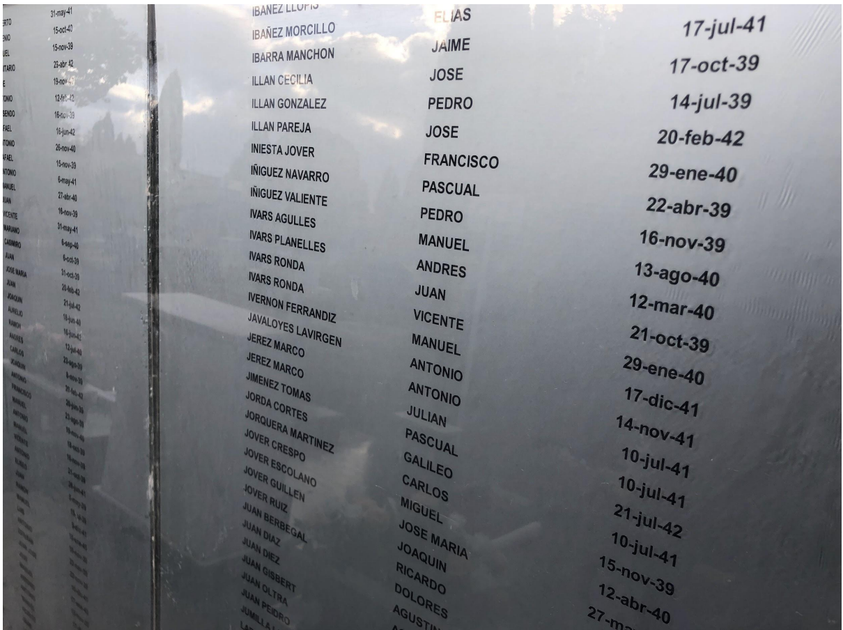
Monument en record als afusellats al costat de les fosses del Cementiri de la Mare de Déu del Remei.