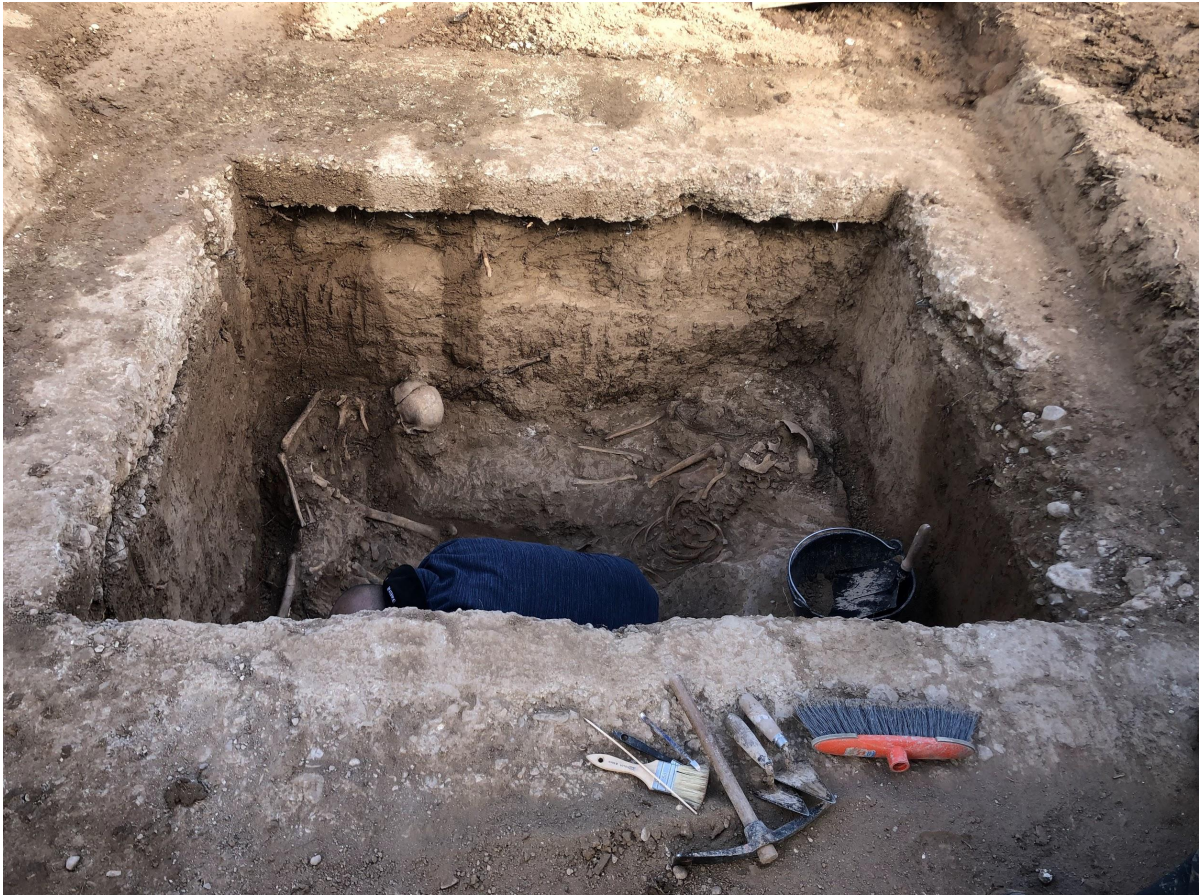
Un dels arquòlegs de Drakkar treballant en l'exhumació de la fossa XXXIII.