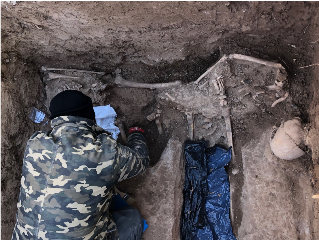
Un dels arqueòlegs de Drakkar treballant a l'exhumació de la fossa XXXIII.