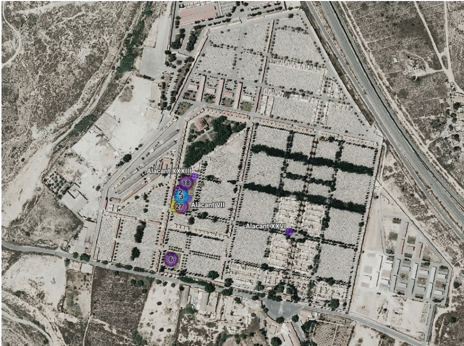
Vista aèria del cementiri d'Alacant

El Cementiri Municipal de la Mare de Déu del Remei d'Alacant té una superfície total de 223.674 m 2 i està dividit en quadres numerats. En ell hi ha 41 fosses comunes , anomenades per nombres romans del I al XLI i repartides entre els quadres 12 i 19 .