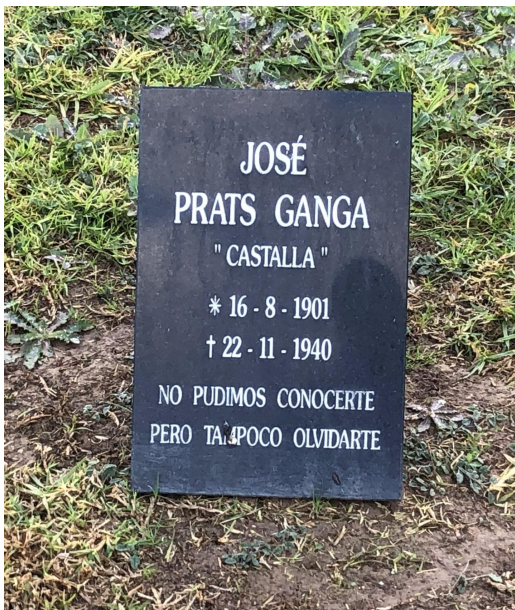
Làpida en record als afusellats sobre les fosses del Cementiri de la Mare de Déu del Remei.

El mapa del cementiri d'Alacant està distribuït en quadres delimitats per carrers. És com una ciutat en miniatura, com un poblat però sense cases. Els quadres 12 i 19 són els que alberguen les fosses comunes. És fàcil identificar-los perquè són els únics quadres de tot el cementiri on gairebé no hi ha tombes. Són dues esplanades de gespa (les quals es poden trepitjar i caminar pel damunt tranquil·lament), amb petites làpides col·locades quasi aleatòriament sobre el terra en memòria dels afusellats, gravades amb frases com "no vam poder conèixer-te, però tampoc oblidar-te".