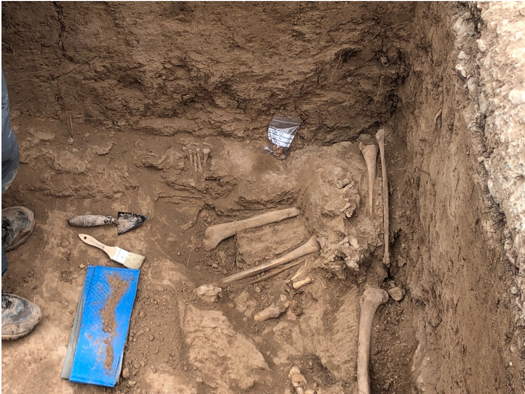
Els peus entrecuats de dos individus de la fossa XXXIII