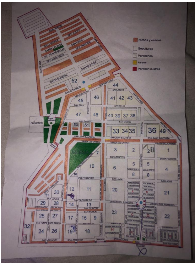
Mapa del cementiri d'Alacant.