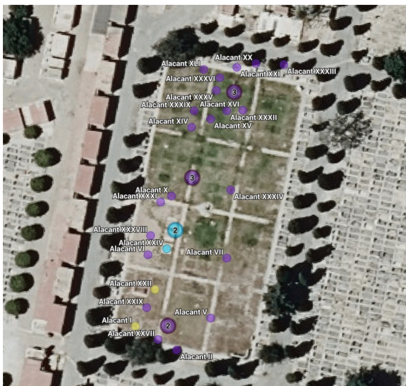
Vista aèria del quadre 12 del Cementiri de la Mare de Déu del Remei.

El quadre 12 és el més gran. Hi ha un total de 35 fosses comunes , que són les següents: I, II, III, IV, V, VI, VII, X, XI, XII, XIII, XIV, XV, XVI, XVII, XVIII, XIX, XX, XXI, XXII, XXIII, XXIV, XXV, XXVI, XXVII, XXIX, XXXI, XXXII, XXXIII, XXXIV, XXXV, XXXVIII, XXXIX, XLI. De totes aquestes, tres corresponen a bombardejos de l'aviació italiana (la XXIII, XXIV i XXV), dues a víctimes de la repressió republicana (la I i la XXII) i la resta corresponen a víctimes de la repressió franquista.