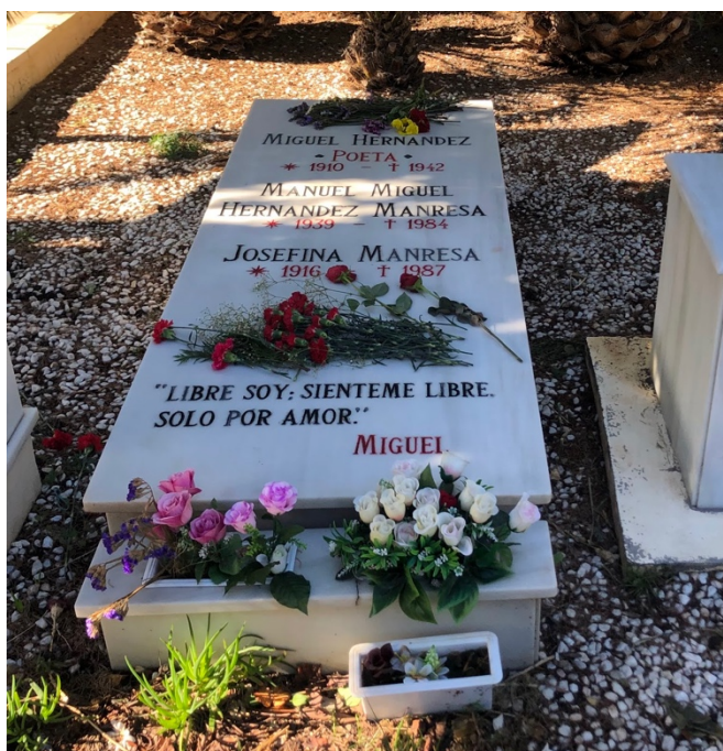
Fossa XXVI: tomba de Miguel Hernández al Cementiri de la Mare de Déu del Remei.

D'altra banda, a la vista aèria del cementiri també es pot contemplar que hi ha una fossa allunyada de la resta, la fossa XXVI. En aquest cas, no es tracta d'una fossa en sí, encara que es reconegui com a tal. És la tomba del poeta Miguel Hernández, que també va ser víctima de la repressió franquista, però en el seu cas no per afusellament. Miguel Hernández va emmalaltir a la presó degut a les condicions infrahumanes a les que estaven sotmesos els presoners i va morir com a conseqüència.