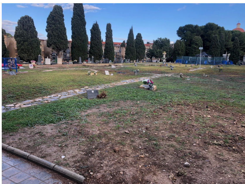
Quadre 12 del Cementiri de la Mare de Déu del Remei.