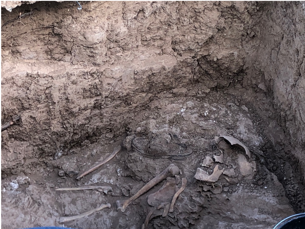
Les restes d'una sabata a la fossa XXXIII.