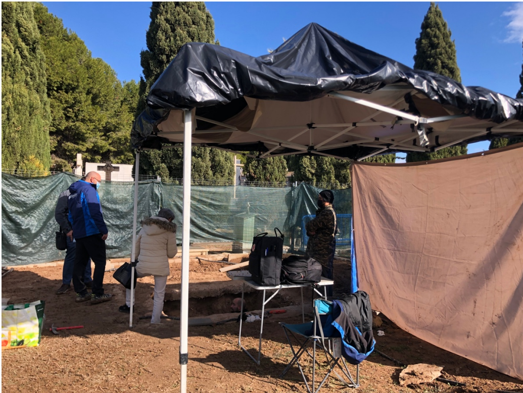
Els arqueòlegs de Drakkar i la Fini de Haro al terreny d'exhumació de la fossa XXXIII.