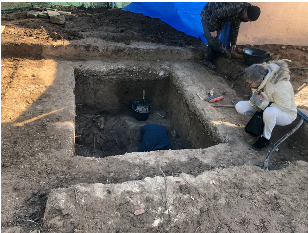
La Fini de Haro ajupida davant de la fossa XXXIII.