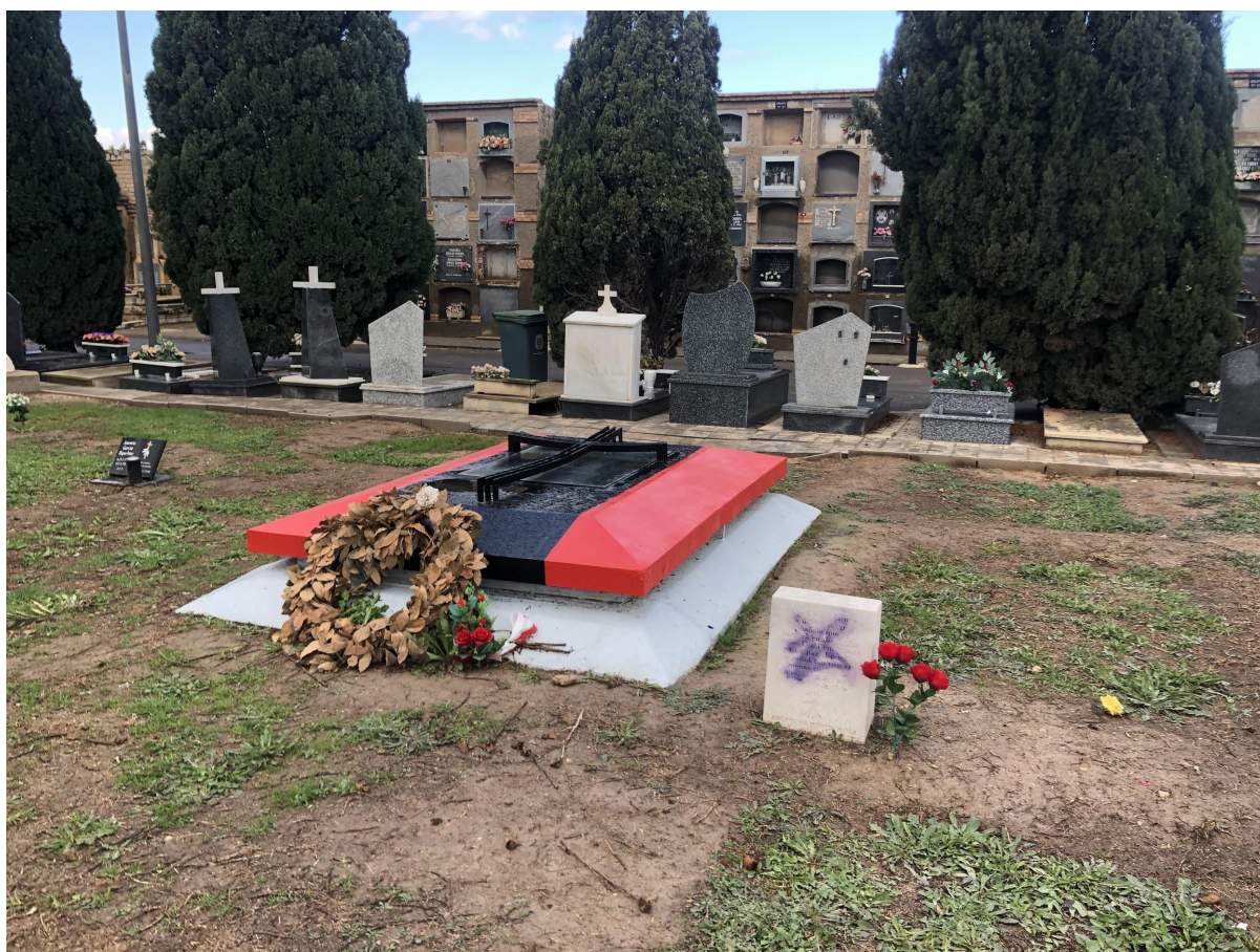
Tomba de José Antonio Primo de Rivera al Cementiri de la Mare de Déu del Remei.

Al cementiri d'Alacant hi ha fosses comunes que no corresponen a represaliats del franquisme. En aquest cas, hi ha dues fosses (la I i la XXII) que en el seu moment albergaven els cossos d'alguns represaliats de la rereguarda republicana, entre ells el de José Antonio Primo de Rivera. Ambdues fosses van ser exhumades i traslladades al Valle de los Caídos durant la dictadura com a homenatge a les víctimes. Una d'elles, però, la fossa XXII, malgrat romandre buida, s'ha convertit en una tomba d'homenatge a Primo de Rivera.