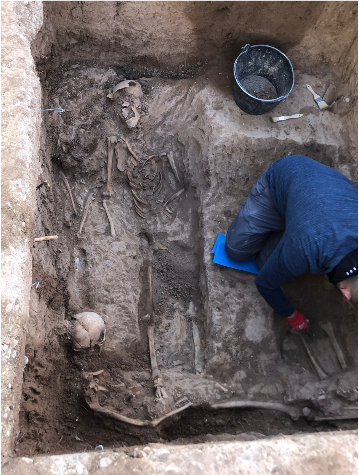
Un dels arqueòlegs de Drakkar treballant a l'exhumació de la fossa XXXIII.