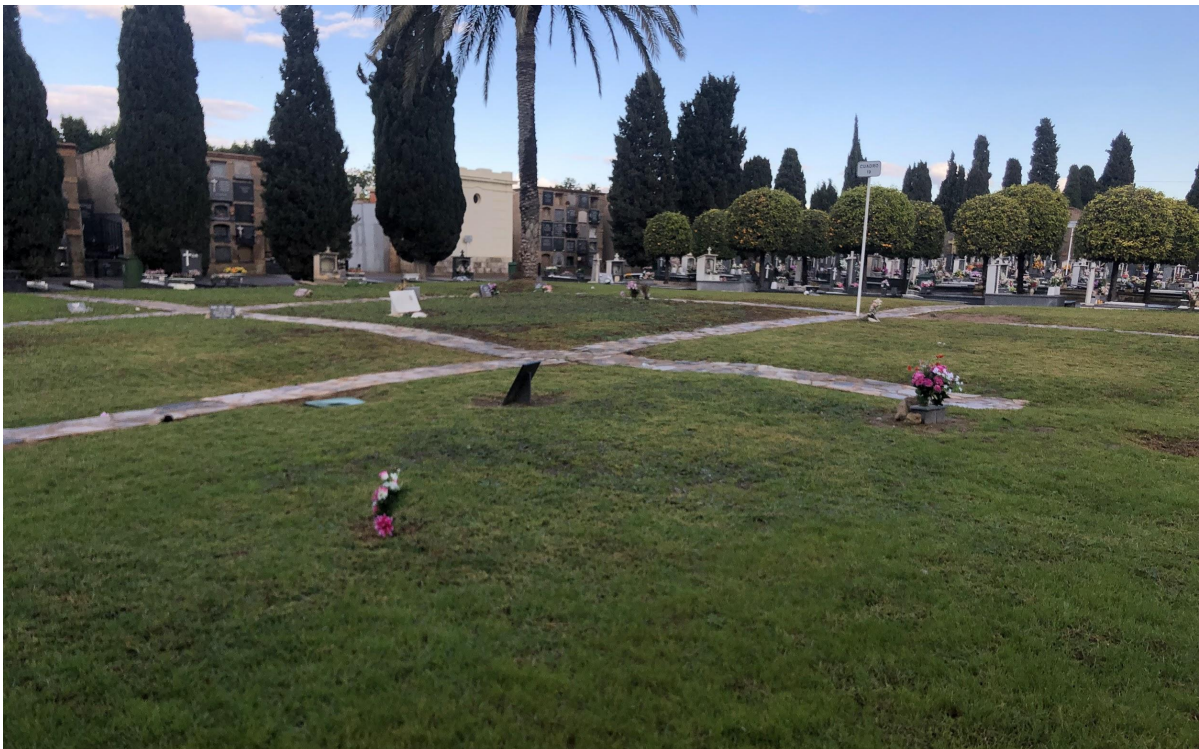
Quadre 19 del Cementiri de la Mare de Déu del Remei.