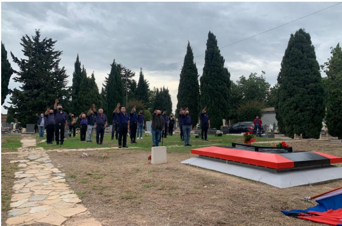
Membres de la Falange Espanyola fent la salutació feixista davant de la tomba de Primo de Rivera com a gest d'homenatge amb motiu de l'aniversari de la seva mort. 2020.