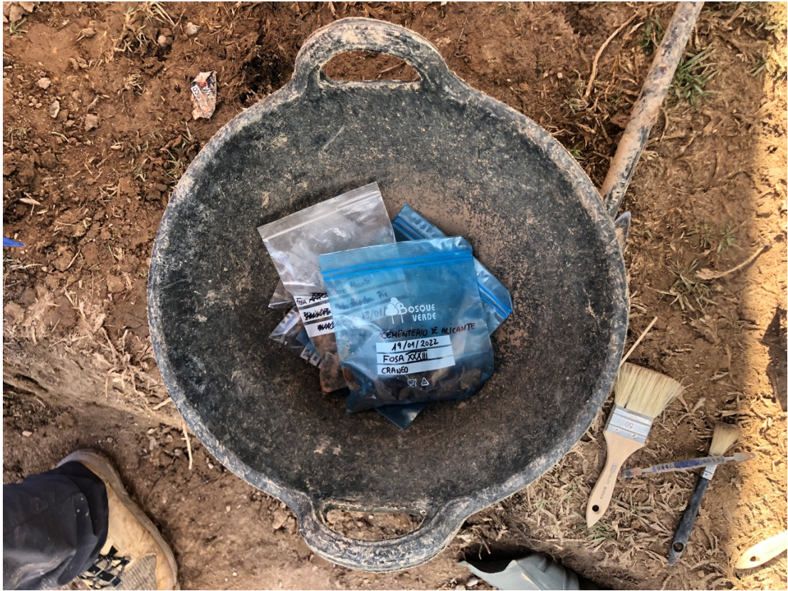
Ossos extrets de la fossa XXXIII.