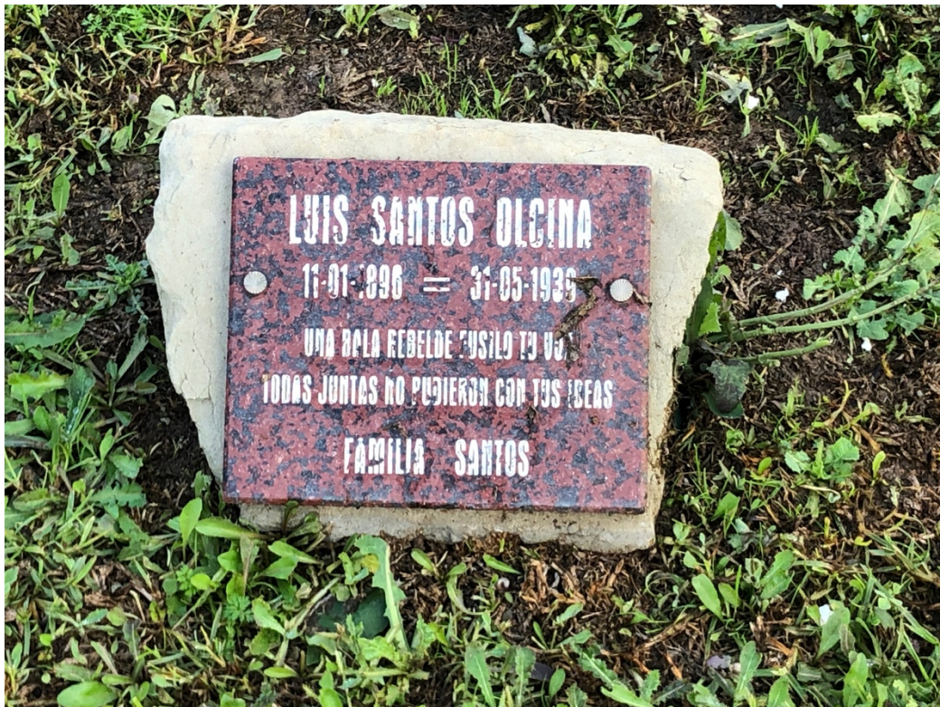
“Una bala rebelde fusiló tu voz. Todas juntas no pueden con tus ideas” – Familia Santos