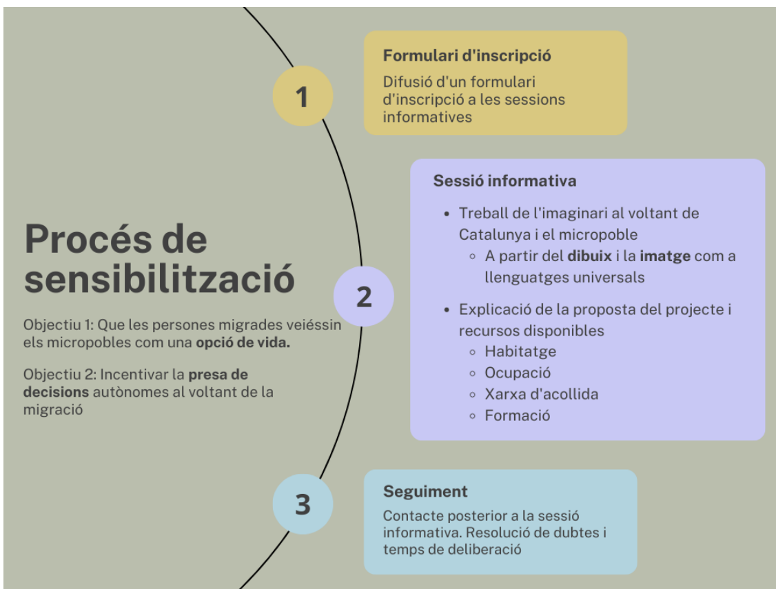
Figura 4. Esquema gràfic resum del procés de sensibilització