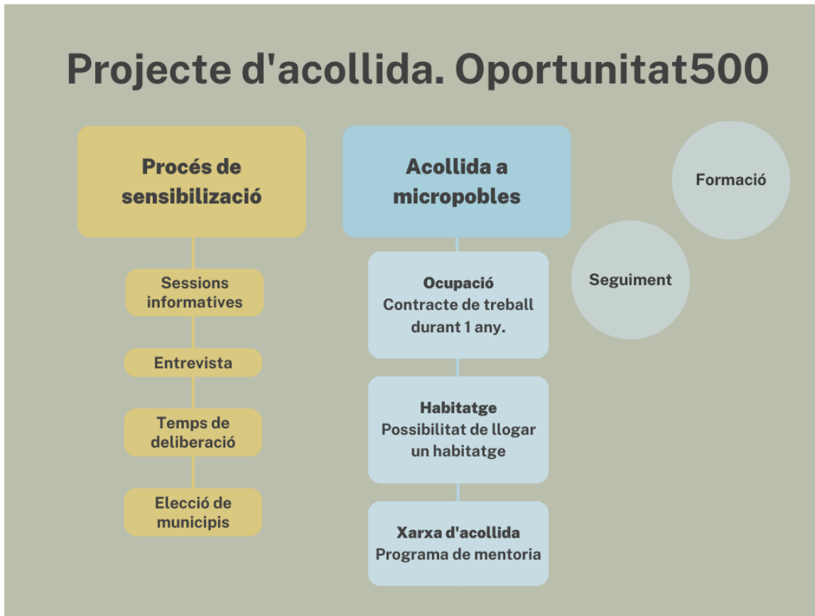
Figura 3. Esquema gràfic del funcionament del projecte