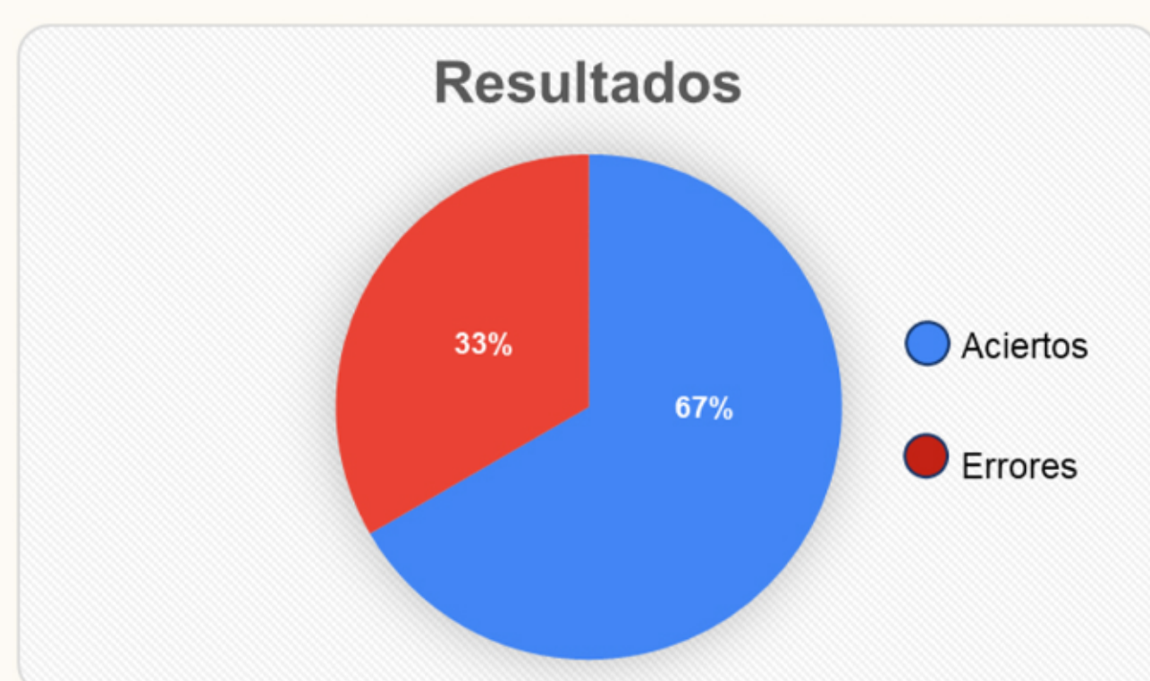
GRÁFICO DE LOS RESULTADOS