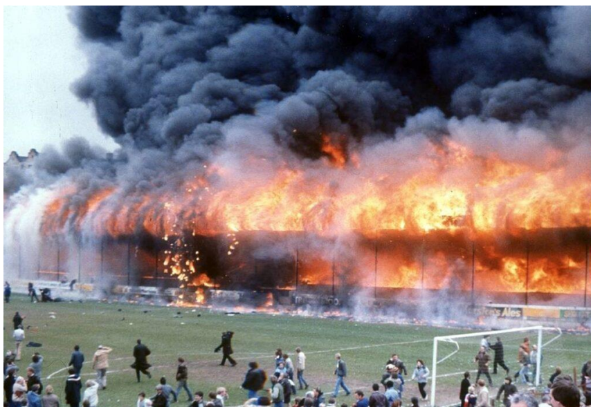
La grada del estadio de Valley Parade envuelta por las llamas.

El partido transcurría con total normalidad, pero a falta de cinco minutos para el final del encuentro, se observaron los primeros signos de llamas provenientes del sector G de la grada. 12 Dos minutos después, alertado por el juez de línea de lo que estaba ocurriendo, el colegiado decidió suspender el partido. La grada era de madera y el techo estaba cubierto con una tela altamente inflable. Esta combinación de materiales provocó que la grada quedase engullida por el fuego rápidamente. En total, 11.076 personas se encontraban presenciando el encuentro ese día. 13 Con el fuego desatado, la gente intentó escapar, muchos de ellos sin suerte. Algunos saltaron al terreno de juego, y otros intentaron escapar por los tornos de entrada al estadio. Los que eligieron esa segunda opción quedaron atrapados, ya que habían sido cerrados para que la gente no accediese al recinto sin entrada. 14 En total, 56 espectadores perdieron la vida y 256 más quedaron heridos.