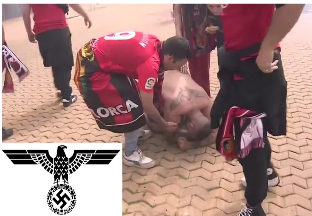
Ultra de Supporters Mallorca tendido en el suelo, mostrando el tatuaje del águila nazi en su espalda.

Además, muchas veces se puede apreciar que los miembros de estos grupos exhiben simbología de calado ideológico, ya sea en las gradas, mediante pancartas, o con tatuajes. Uno de estos ejemplos se pudo ver el pasado 6 de abril, cuando se celebró la final de la Copa del Rey en Sevilla. Los ultras del Mallorca, Supporters Mallorca, protagonizaron una pelea con los ultras del Athletic Club, Herri Norte Taldea. Una de las personas del grupo mallorquinista recibió un golpe en la cabeza con una silla y quedó tendido en el suelo. De esta forma, se pudo apreciar el tatuaje que el sujeto llevaba en la espalda, el cual era de simbología nazi. Se trata de un águila con la cabeza girada hacia la derecha, también llamada Parteiadler en alemán, la cual fue uno de los símbolos del Partido Nazi.