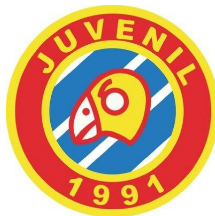
Logo de la Peña Juvenil 1991.

Ampliando esta definición, Requena califica a un ultra como alguien “más allá de un aficionado normal y corriente, un aficionado que le gusta estar al lado del equipo, que le gusta viajar con él, que le gusta realizar