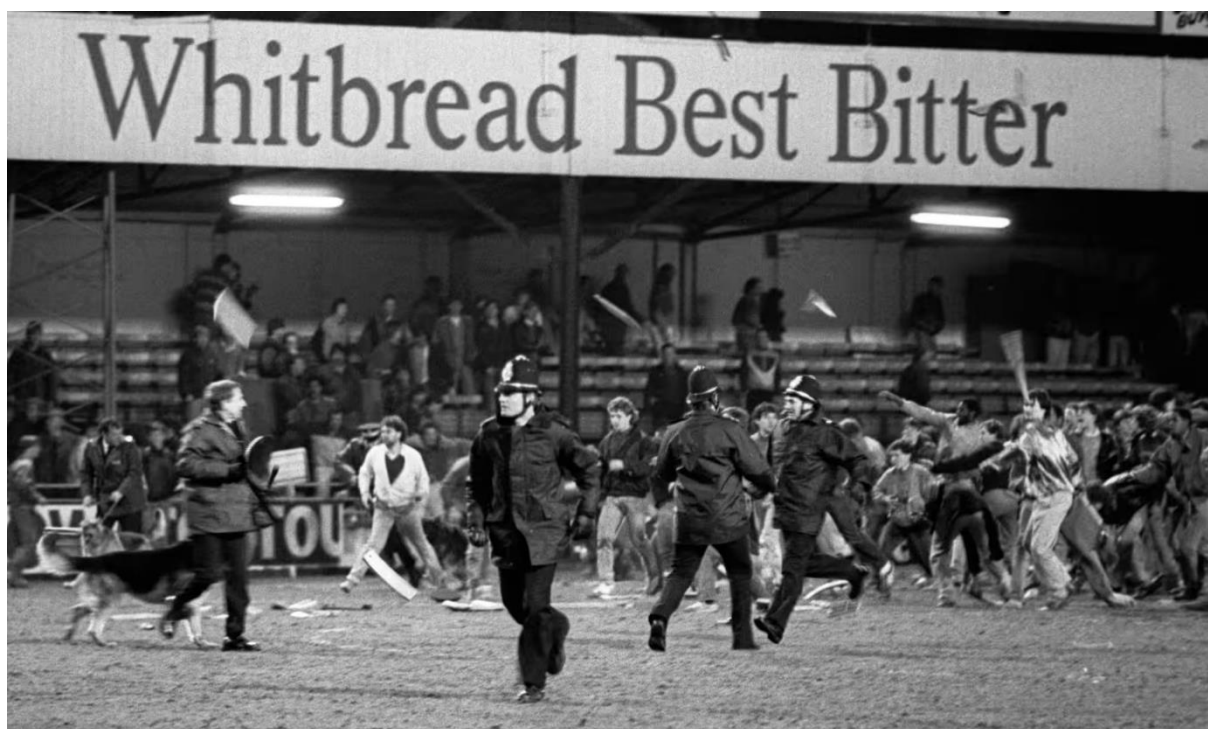
Imágenes de los hooligans del FC Millwall atacando a la policía durante los disturbios de Luton en 1985.

alrededor de las gradas. La peor parte, sin embargo, llegó con el pitido final. Los hooligans saltaron al césped, y las escenas violentas cogieron aún mayor intensidad. En total, hubo 47 hospitalizados y 31 detenidos. 5