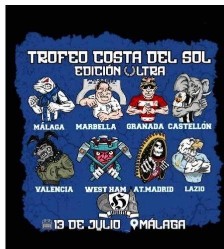
Cartel promocional del Trofeo Costa del Sol. Edición Ultra.

Un ejemplo es el “Trofeo Costa del Sol. Edición Ultra” 41 . Esta competición que se promociona en varias cuentas de redes sociales se celebrará el 13 de julio en Málaga y juntará a miembros de Frente Bokerón (Málaga CF), Ultras Marbella (Marbella FC), Curva Sur Granada (Granada CF), Frente Orellut (CD Castellón), Ultra Yomus (Valencia CF), WHU (West Ham United), Suburbios Firm (Club Atlético de Madrid) y Ultras Lazio (SS Lazio), todos ellos con un factor en común, su ideología de, su ideología de extrema derecha.