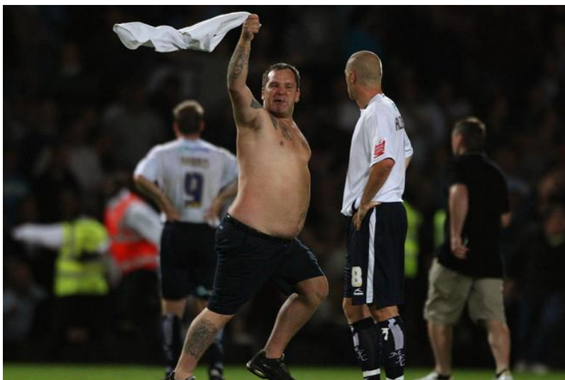
Un hooligan del West Ham United corriendo delante de un jugador del FC Millwall durante la invasión de campo de Upton Park de 2009.

provocativo, los insultos racistas y el lanzamiento de objetos peligrosos”. Del mismo modo, el conjunto local también recibió cargos por la invasión de campo por parte de sus aficionados. 11