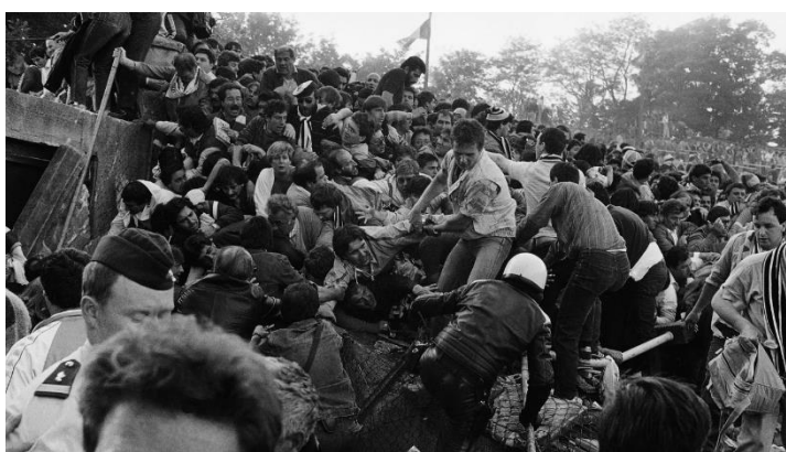
Momento en que se produce la avalancha en el estadio de Heysel.

Solo una valla separaba a ambos bandos, y los hooligans tardaron poco en saltarla. Los aficionados del equipo de Turín intentaron huir ante la actitud violenta de los de Liverpool. Pero aquel sector Z del estadio de Heysel era una ratonera. Muros, vallas fijas y la falta de salidas de emergencia