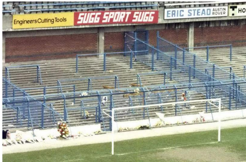
Los pens de las gradas del estadio de Hillsborough en 1989.

El túnel central conducía a los pens 3 y 4, mientras que el otro túnel, más estrecho, llevaba al resto de secciones de esa parte de la grada. La escasez de tornos para validar las entradas provocó que se acumulara mucha gente fuera. De los aproximadamente 10.000 fans del Liverpool que debían entrar al estadio por ese acceso, más de la mitad se encontraban aún fuera a falta de 30 minutos para el inicio del partido. Viendo la situación, David Duckenfield, un inexperto policía que estaba a cargo del dispositivo, tomó una decisión que resultaría mortal: Abrir un segundo acceso. Aproximadamente 2.000 aficionados se apresuraron a entrar por ese acceso, dirigiéndose a los pens 3 y 4, que eran los que ya estaban llenos. El exceso de gente que allí se acumuló provocó una avalancha mortal que se saldó con 97 víctimas.