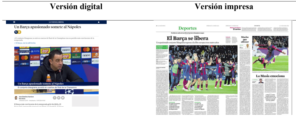
Imagen 6: Publicación post-partido Barça contra el Nápoles