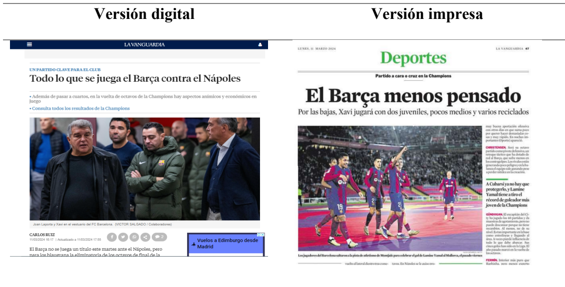
Imagen 1: Publicación pre-partido Barça contra el Nápoles (11-03-2024)

Teniendo en cuenta que el título de un artículo