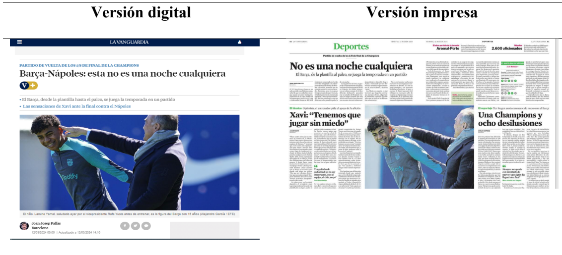
Imagen 4: Publicación pre-partido Barça contra el Nápoles (12-03-2024)

En ambos casos se hace uso del mismo título central, el cual se describe altamente relevante, ya que destaca la importancia del partido entre el Barça y el Nápoles en la fase de los 1/8 de final de la Champions League. Este enfoque en un partido específico y su relevancia para la competencia es crucial para captar la atención del lector.