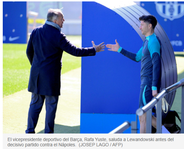
Imagen 3: Publicación 3 pre-partido Barça contra el Nápoles (11-03-2024)