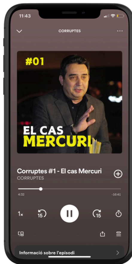
Corruptes #1 - El Cas Mercuri. Disseny fet amb Canva.

Cliqueu en aquest link per escoltar Corruptes #1 - El cas Mercuri .