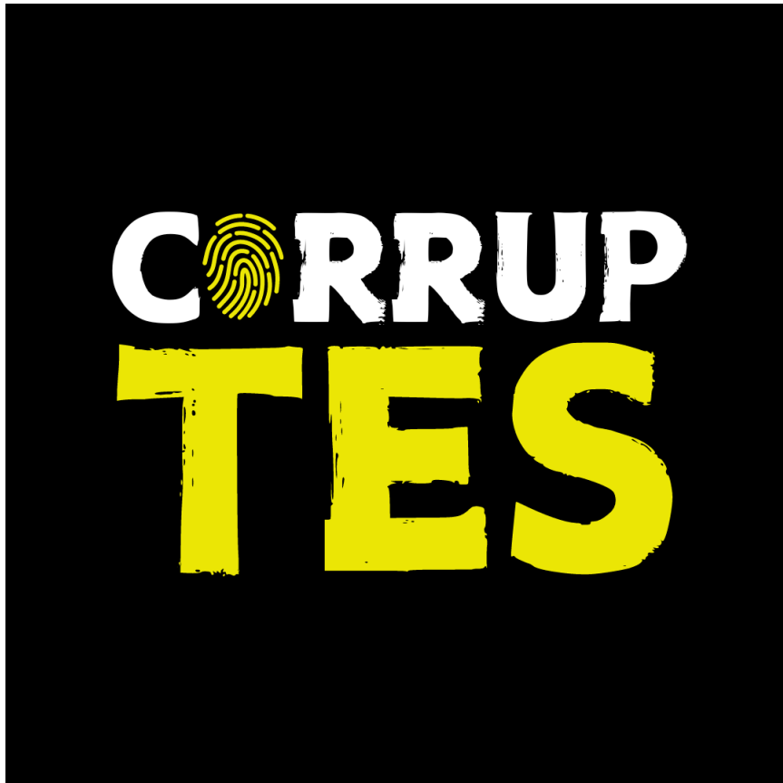
Logotip de Corruptes. Disseny fet amb Canva.

A part del logotip genèric que ens acompanyarà a tots els canals de comunicació propis per crear marca, també hem creat una imatge específica de cara a la portada del nostre perfil de Spotify, on les caretes dels pòdcasts solen anar acompanyades d'una imatge més cridanera i potent, no tan minimalista com a les xarxes socials. Per la fotografia, hem seleccionat una de Pexels, un banc d'imatges amb imatges lliures de drets d'autor, que captura un home d'esquena mirant per la finestra d'una presó, amb la intenció que inciti a l'oient a escoltar el producte.