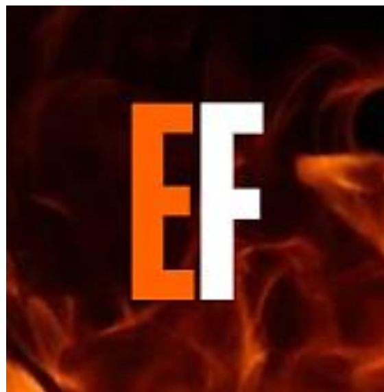
Ilustración 2. Submarca de “Egos Fundidos”

Para complementar el título de “Egos Fundidos”, se ha creado un logotipo secundario o submarca, como una versión comprimida que se puede usar como foto de perfil en redes sociales, como firma o como icono reconocible del producto.