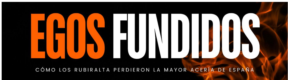
Ilustración 1. Logotipo principal de “Egos Fundidos” [Elaboración propia].

Las portadas de los episodios del pódcast y el título de “Egos Fundidos” son de creación propia utilizando la aplicación Canva. En este caso, los colores escogidos son el negro, el blanco y el naranja para transmitir oscuridad y misterio, pero a la vez que sea atractivo para el público. El detalle del fuego hace referencia a las actividades que desempeña Celsa con sus grandes hornos en sus acerías.