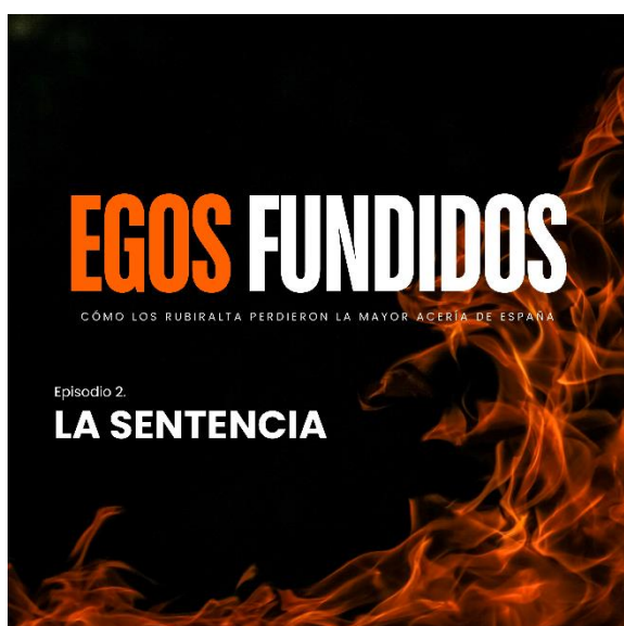
Ilustración 4. Portada episodio 2 "La sentencia" [Elaboración propia]