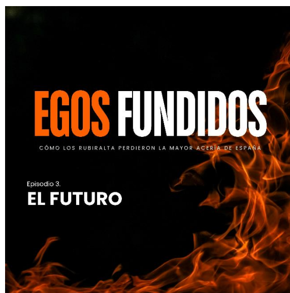
Ilustración 5. Carátula del episodio 3 "El futuro" [Elaboración propia]