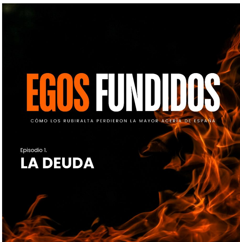
Ilustración 3. Carátula del episodio 1 "La deuda" [Elaboración propia]

Asimismo, a continuación, quedan expuestas las portadas o carátulas de cada uno de los capítulos del podcast serial personalizados con el número de episodio y el título.