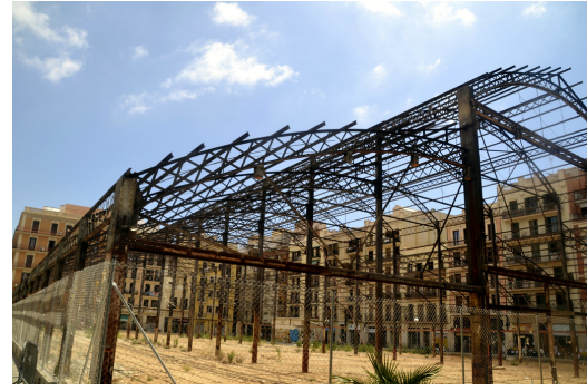
Fig. 2: Imatge del 2023 del mercat de l'Abaceria

Aquest treball consta d'un abstracte, una introducció, uns objectius, un marc teòric i una posterior anàlisi de resultats i la seva pertinent discussió.