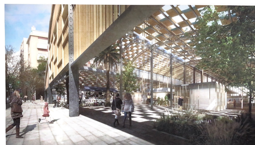
Fig. 5: Imatge de la proposta definitiva del mercat de l'Abaceria des de Puigmartí i el carrer Torrijos [2]