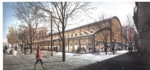
Fig. 4: Imatge de la proposta definitiva del mercat de l'Abaceria des de Travessera de Gràcia i el carrer Torrijos [2]

En aquesta nova proposta, es fa recular tota la façana del carrer Mare de Déu dels Desemparats per destinar-ho a un espai verd i públic sota de l'estructura del mercat. A la Fig. 4 i Fig. 5 s'hi pot veure dos renders des de diferents perspectives de la proposta definitiva fets per l'IMMB i a l'Annex a la Fig. 7 una imatge del planell de la planta principal de la proposta definitiva del mercat de l'Abaceria.