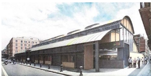
Fig. 3: Imatge de la primera proposta del mercat des del carrer travessera de Gràcia amb carrer Torrijos [2]

La primera proposta més pública, es va presentar el juliol del 2016. La primera proposta valorava posar les parades alimentàries a la façana de travesser de Gràcia (actualment situades al mercat provisional a passeig de Sant Joan). Darrer d'aquests hi hauria dues rampes, una d'entrada i una de sortida. A la mateixa planta, hi hauria totes les parades alimentàries del mercat, en funció d'un estudi previ que es va fer a tots els paradistes per saber si en un futur voldrien continuar treballant al mercat, i per tant ens queda un espai alliberat, el qual aniria destinat una part (350 m quadrats) a una cooperativa de productors (la primera vegada que es preveu un espai d'aquestes característiques). Aquest espai apareix a través del procés participatiu arran de la demanda d'una entitat del barri, Gràcia a on vas. I finalment un supermercat. Sense el procés participatiu, s'hauria destinat la totalitat de l'espai sobrant a un supermercat i no a una cooperativa. Les dimensions del supermercat (750 metres quadrats) és causat per la demanda dels supermercats, ja que, a part de la subhasta per adquirir la superfície, també es valora la proposta qualitativa del supermercat i els grans supermercats no s'hi presentarien. A l'Annex a la Fig. 6 s'hi pot veure un planell de la planta principal de la primera proposta de modificació del mercat de l'Abaceria i a la Fig 3 un render de la primera proposta del mercat des del carrer Travessera de Gràcia amb carrer Torrijos.