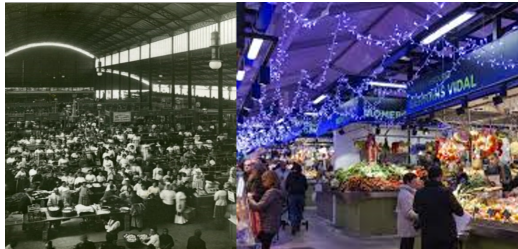
Fig. 1: Imatge comparativa del Mercat de la Revolució i Mercat de l'Abaceria Central [4] [3]

No va ser fins al 1965 que el mercat va patir una remodelació per canviar l'interior del mercat, on fins al moment, a l'interior, només hi havia taules de fusta o marbre on els comerciants col·locaven els seus productes, això permetia una plena visió del mercat. Amb la remodelació, el mercat va agafar una forma molt diferent, tal com es pot veure a la Fig. 1. Va ser també a aquella època que es va canviar el nom per Abaceria central.