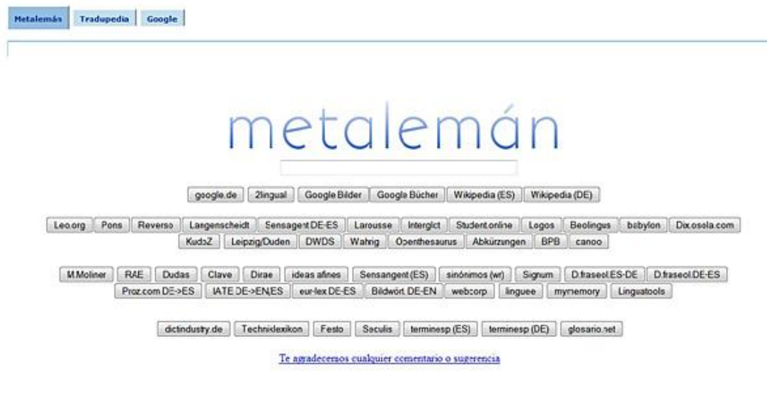
Figura 1. Metabuscador Metalemán.

Este metabuscador, además de ofrecer recursos para realizar búsquedas que sirvan de apoyo a la traducción de textos alemán-español, ofrece otras opciones de búsquedas basadas en Wikipedia. En primer lugar, la opción Tradupedia , un buscador multilingüe de equivalentes en artículos de la enciclopedia; en segundo lugar, el Corpuspedia , que permite utilizar la Wikipedia como un corpus y, así, realizar búsquedas monolingües en sus artículos de la sección alemana, española, inglesa y francesa; en tercer lugar, encontramos Bikipedia , que facilita la búsqueda de términos o expresiones en las secciones alemanas y españolas de Wikipedia como si se tratara de un corpus bilingüe paralelo, es decir, permite la búsqueda de unidades en el corpus alemán o español y en sus traducciones en español o alemán, respectivamente. Finalmente, encontramos la opción Mindpedia , que nos ofrece la posibilidad de consultar mapas conceptuales en formato de la herramienta Freemind (.mm) elaborados de forma automática a partir de la consulta realizada en las páginas de Wikipedia .