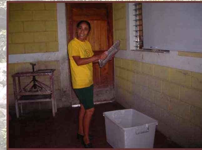
Fábrica de papel La Tunoza