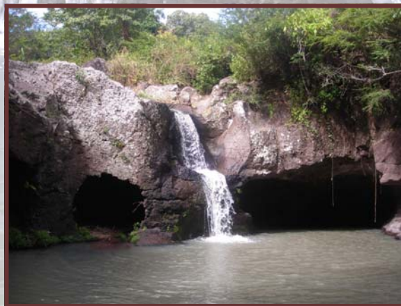
Cuevas de la Queserita