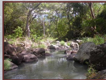
Entorno de las cuevas de la Queserita

EL CAMINO DE ACCESO NO ES FÁCIL YA QUE NO HAY PANELES INDICATIVOS, POR LO QUE SE NECESITA IR CON UN GUÍA. EL ESTADO DEL CAMINO ES MUY MALO, HAY OBSTÁCULOS Y MUCHO LODO (EN ÉPOCA LLUVIOSA) Y SE DEBE PASAR POR PROPIEDADES PRIVADAS.