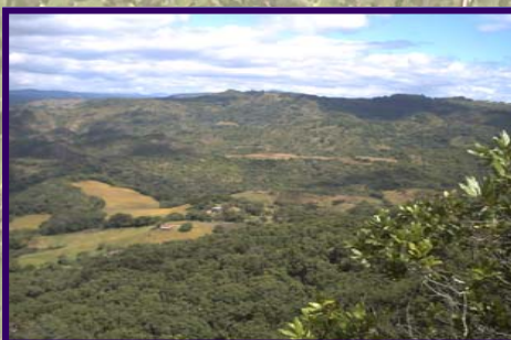
Paisaje de la mina de marmolina

de llegar a la comunidad de La Almaciguera, se encuentra el cruce de La Eco Posada Los Cerrato.