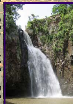
Salto de La Estanzuela

23. Saliendo de la finca, se vuelve hasta el cruce de El Quebracho y se agarra el autobús, que pasa a las 5:10 pm. El trayecto es de 20min y tiene un precio de 8CS.