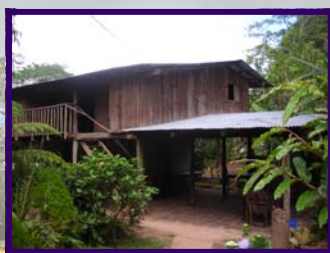
Eco Posada Los Cerrato