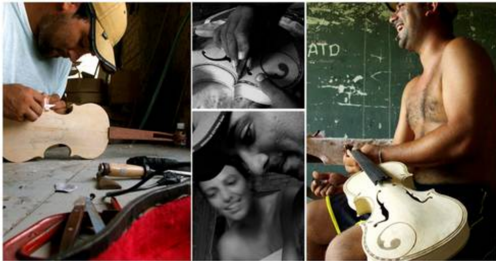
Figura 1 Construcción de instrumentos en la sede de la Asociación de Jóvenes de la Juréia.

Todos miembros de la asociación entrevistados resaltaron la importancia de internet como medio de comunicación y articulación política, como posibilidad de atraer más jóvenes para el punto de cultura y para la valorización de la cultura caiçara y como herramienta educativa. Un joven maestro artesano que construye rabeca (un tipo de violín rustico) afirmó que usa la red internet para investigar y perfeccionar su técnica de construcción y mejorar la sonoridad del instrumento.