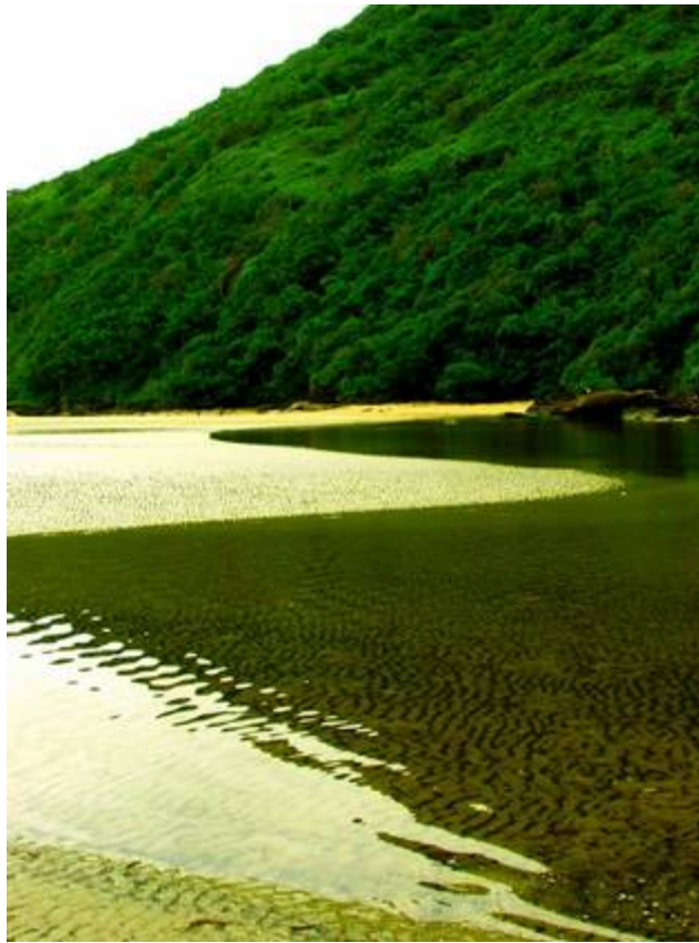
Figura 2 Estación Ecológica da Juréia

condiciones materiales de producción cultural, actúa en la autoestima – esencial para el ejercicio de la ciudadanía - consolidando y ampliando el orgullo de ser caiçara.