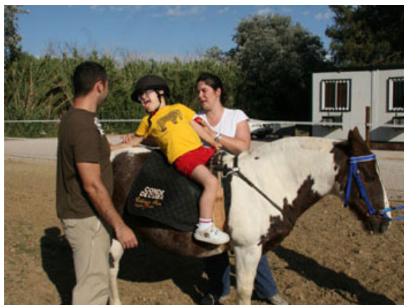
Figura 1: Teràpia en poni amb un nen amb Síndrome de Down