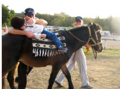
Fig 5: Postura estirada sobre el llom.

En aquesta teràpia, el pacient no només realitza un exercici passiu a través del cavall, sinó que també fa exercicis per a relaxar-se, estirar-se i millorar l'equilibri, els reflexes i la coordinació. Una altra modalitat és el volteig, que consisteix en efectuar exercicis gimnàstics sobre el cavall mentre aquest fa voltes a la corda.