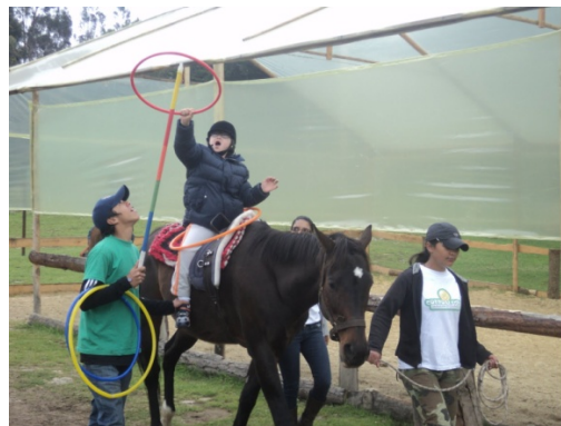
Figura 4: Jocs que motiven l'exercici sense

És important tenir en compte la història mèdica del pacient, saber les capacitats i dificultats, el tipus d'escolarització, fixar objectius i tenir un seguiment del progrés.