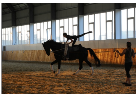
Fig 6: Volteig

La cadència rítmica i constant del cavall en caminar, proporciona una forma ideal de treball i estímul. La possibilitat de variar les cadències, augmentant o disminuint els ritmes del moviment, així com la variació dels aires del cavall (pas, trot i galop), permeten una gran varietat de possibilitats d'estímul. Uns 110 moviments diferents transmet el cavall en caminar, i no hi ha múscul ni zona corporal al que no es transmeti un estímul. Un aspecte molt important d'aquesta teràpia és que el pacient assumeix els exercicis alhora com a una diversió, lluny d'un tractament, de l'ambient convencional de teràpia, i es manté entretingut i atent al que passa al seu voltant. Els exercicis passen a un segon pla per a ell, mentre que el sistema nerviós central està treballant i s'obtenen els resultats i avanços esperats.