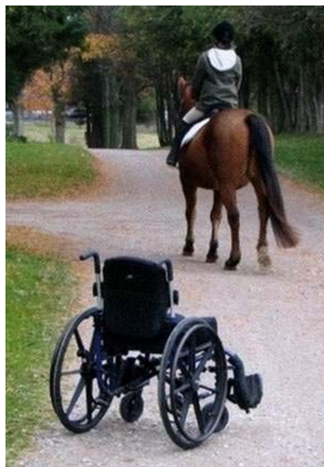
Figura 3: Tenir una discapacitat no és un obstacle per muntar a cavall

Les primeres investigacions per a demostrar el valor terapèutic de l'equitació , es veuen al 1875, quan el neuròleg francès Chassaignac descobreix que un cavall en acció, millora l'equilibri, el moviment articular i el control muscular dels seus pacients. Les seves experiències el van convèncer de que muntar a cavall millorava l'estat d'ànim i que era particularment beneficiós pels paraplàgics i pacients amb altres trastorns neurològics.