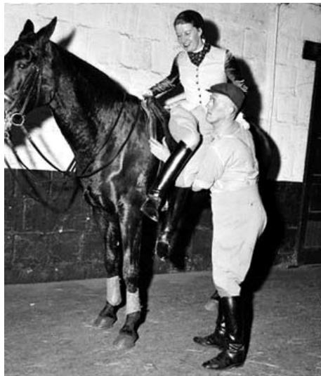
Figura 4: Liz Hartel

En el 1901 a Anglaterra, a l'hospital ortopèdic d'Owestry, es va començar a realitzar una primera aplicació de l'equinoteràpia dins del context hospitalari. Un exemple és el de Liz Hartel, que als 16 anys va patir poliomielitis i va quedar en cadira de rodes i muletetes. Abans practicava l'equitació, i contràriament al que recomanaven els metges va continuar practicant-la. Vuit anys més tard, a les Olimpíades de 1952 va ser premiada amb la medalla de plata en doma competint contra els millors genets del món. El públic només va adonar-se del seu problema quan va baixar del cavall per a pujar al podi amb uns bastons. Això va despertar la curiositat mèdica continuant les investigacions a través d'activitats eqüestres com a mitjà terapèutic, al punt que en 1954 va aparèixer a Noruega el primer equip interdisciplinari format per un fisioterapeuta, un psicòleg i instructor d'equitació, que al 1956 van crear una altra associació a Anglaterra. A França la reeducació eqüestre va néixer al 1965 mencionada per De Lubersac i La Llieri en el seu manual "La reeducació a través de l'equitació". Al 1965, l'equinoteràpia va tornar-se matèria didàctica universitària, i a París va fer-se al 1972 la defensa de la primera tesis doctoral en medicina sobre reeducació eqüestre.