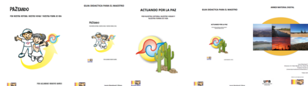
Imatge 4. Portades dels 5 documents. Autor: Laura Rossinyol.