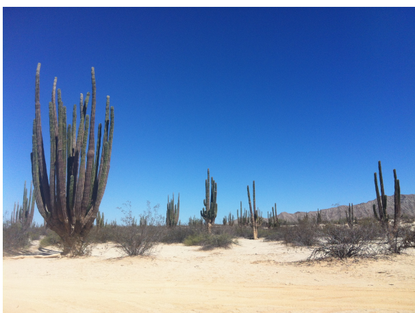
imatge 2. Valle de los Gigantes, s'observen diversos exemplars de Carnegiea Gigantea .

Cal destacar l'elevada contaminació atmosfèrica present a la ciutat. Actualment hi ha en marxa el Programa Frontera 2012 que té per objectiu principal disminuir les emissions de contaminants.