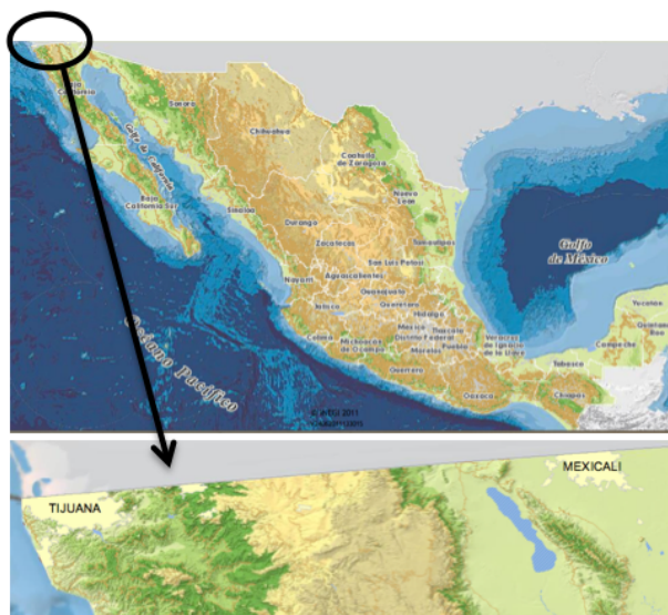
imatge 1. Frontera entre Baixa Califòrnia i els Estats Units.

Mexicali, amb un clima desèrtic càlid, està considerada la ciutat més calorosa de la Terra,. Els hiverns són suaus, frescos i secs i els estius, durant els mesos de juny i juliol, es poden enregistrar temperatures mitjanes de fins a 43°C.