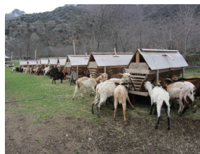
Imatge d'unes cabres alimentant-se.