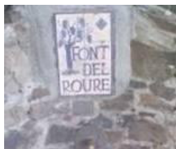
Exemple del cartell a col·locar

Barcelona: Can Llong, Muguera i la Pineda. Esplugues: La Senyora El Papiol: El Trull Sant Cugat: Estrangulador, Maño i Salamandries. Montcada i Reixac. Mitja Costa