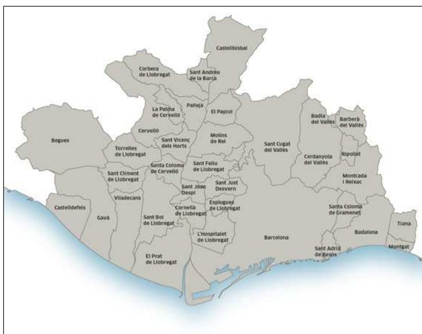
Tabla 3: Mapa con los municipios pertenecientes a Barcelona y su Área Metropolitana de Barcelona. (www.amb.cat, 2013)

Tras esto generé un listado de los municipios que abarca el Area metropolitana de Barcelona.