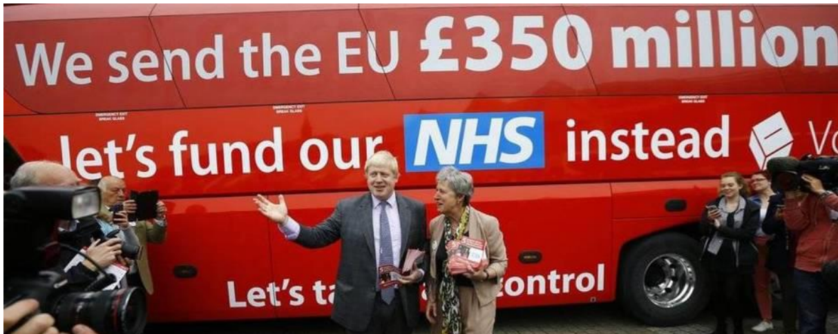
Imagen 1: Boris Johnson y el anuncio del pago a la UE 1

estaba pintada en grandes letras en el autobús de campaña del exalcalde de Londres Boris Johnson. Pero en realidad el pago neto sólo fue de 190 millones de libras semanales como reveló la Oficina Nacional de Estadística (ONS) (La Chistera, 2016).