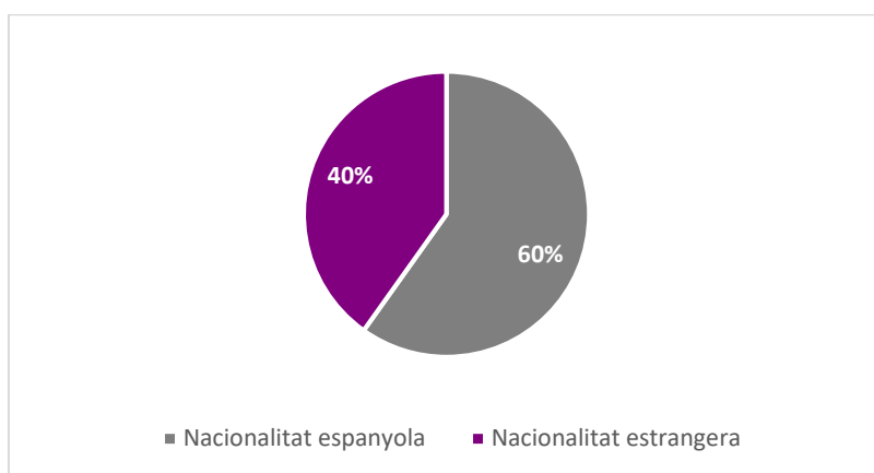
GRÀFIC 2: Població penitenciària femenina segons nacionalitat (2020)

Elaboració pròpia a partir de dades del Departament de Justícia (2021)