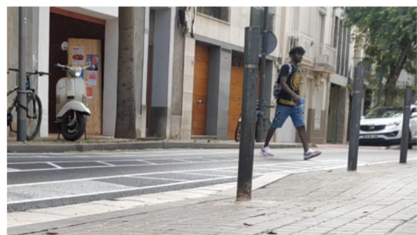
Figura 1.3. L'intervenció d'urbanisme punk. Mosaic fotogràfic d'elaboració pròpia.