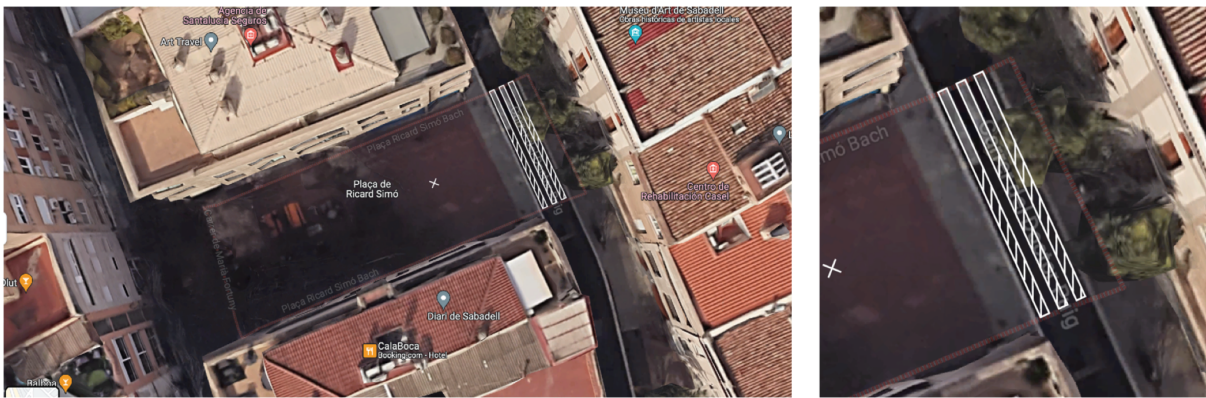
Figura 1.2. Projectió de l'intervenció d'urbanisme punk. Montatge fotogràfic d'elaboració pròpia.

El primer pas en la planificació es tracta de realitzar un fotomontatge de la intervenció proposada. Aquest fotomontatge serveix com a representació gràfica de com es veuria l'espai després de realitzar la intervenció simulant així els canvis desitjats. Aquesta representació visual ajudarà a tenir una visió clara de com serà el resultat final i a comunicar la proposta als membres de l'equip i altres possible actors involucrats.