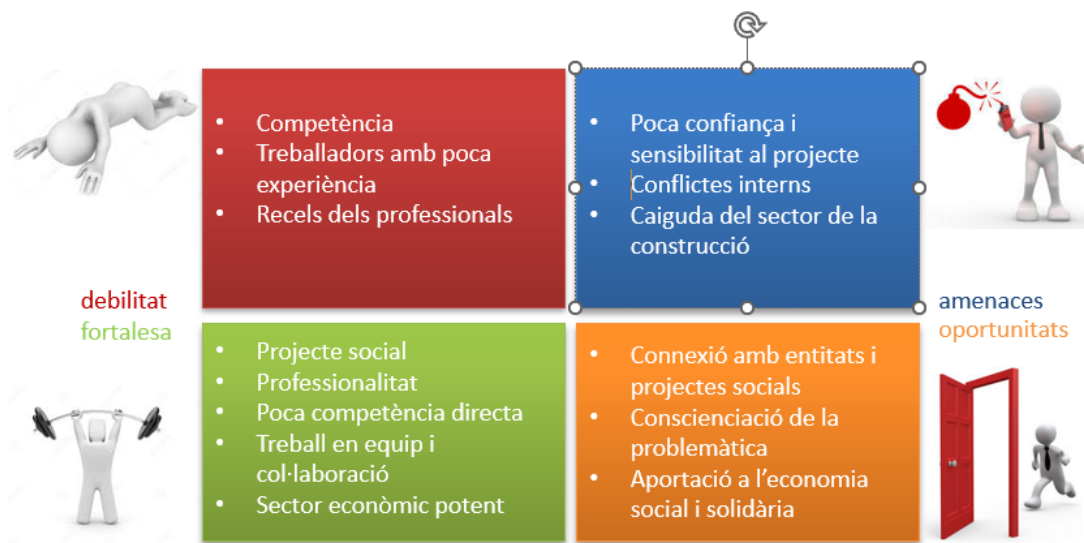
Imatge 2: Anàlisi DAFO de la Dovella