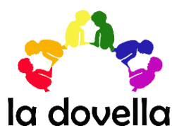
Imatge 1: Logo de la cooperativa

Segons la definició del Wikipedia, una dovella és “una peça trapezoidal feta servir en la construcció d'arcs i voltes que, en ser més estreta d'un costat que de l'altre, fa funció de falca i distribueix les forces dels murs que hi ha a sobre dels arcs”. El nom escollit pel projecte, la Dovella, resumeix molt el que per nosaltres era la base de tot: petites peces que per si soles no fan gran cosa però juntes aconsegueixen ‘sustentar l'arc’. Així per fer viable el projecte calia l'ajuda i recolzament de moltes ‘dovelles’ (entitats i fundacions d'inserció, entitats d'oci, proveïdors i industrials afins al projecte, administració pública, etc).