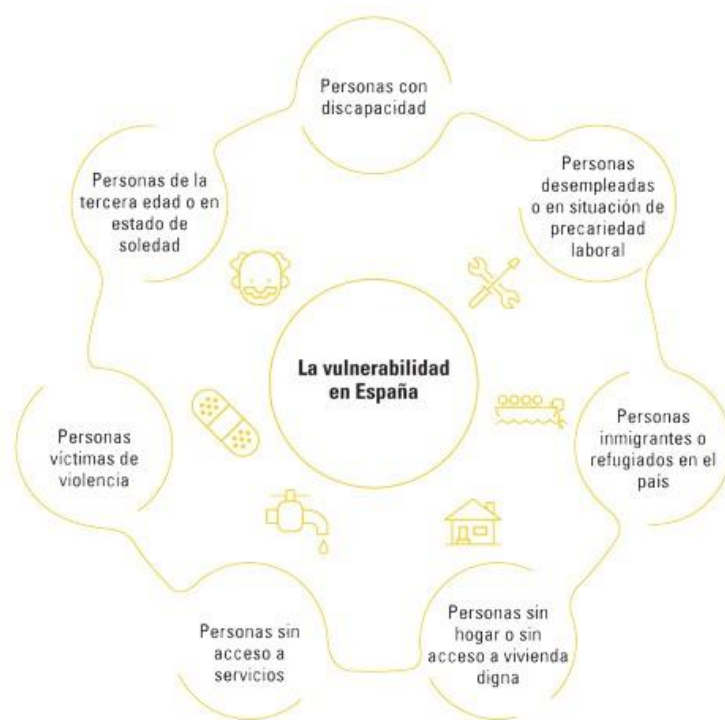
Imatge 3: Classificació de persones vulnerables

Malgrat l'exclusió social està estretament lligada a baixos ingressos de les persones, hi ha altres factors que també incideixen a caure en l'exclusió social i que no estan directament lligats a la renda. Així, aquest quadre representa les persones vulnerables de caure en l'exclusió social per motius econòmics com serien persones a l'atur o amb situació de precarietat laboral, persones immigrants, persones sense sostre i sense accés a un habitatge digne i també mostra col·lectius que poden caure en l'exclusió social però no estan lligats (o poden no estar-lo) a motius econòmics com persones amb discapacitats, persones víctimes de violència i persones de la tercera edat i en estat de soletat.