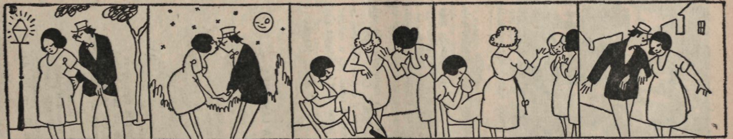
Pero el muchacho la adora y otra vez su amor implora.