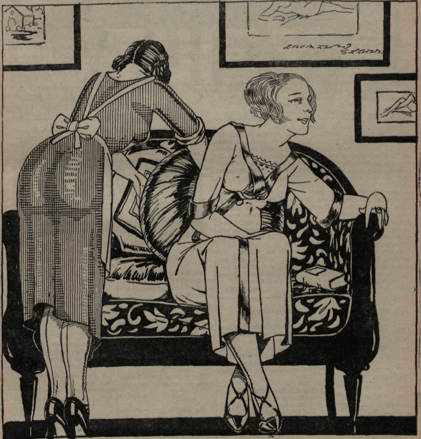
La criada (entre dents). — Tants preparatius i tants romansos i a la primera visita aniran a parar tant ell com ella a sota el sofà.

AQUEST NÚMERO HA ESTAT VISAT PER LA : CENSURA MILITAR :