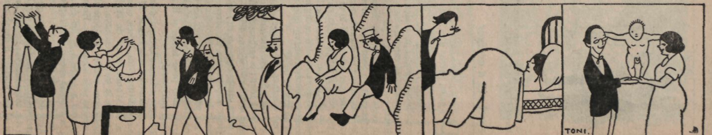
Y se preparan la ropa, pues han de hacer mucha «tropa».