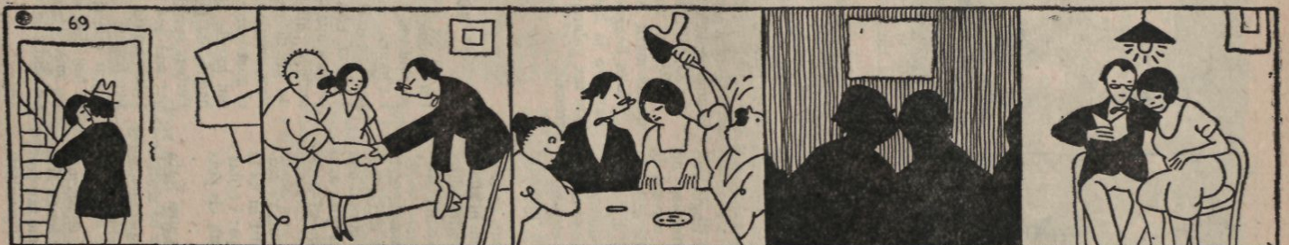
Y en la puerta de la escala más de un suspiro se exhala.