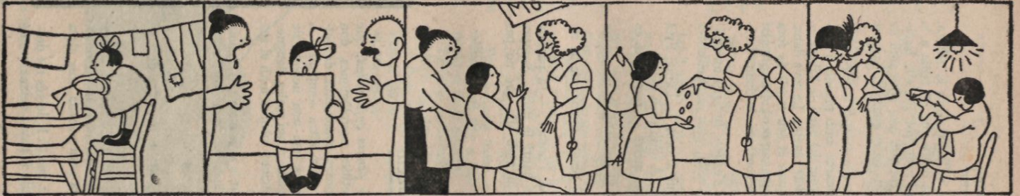
Cuando tres años contaba, ya se cosía y lavaba.