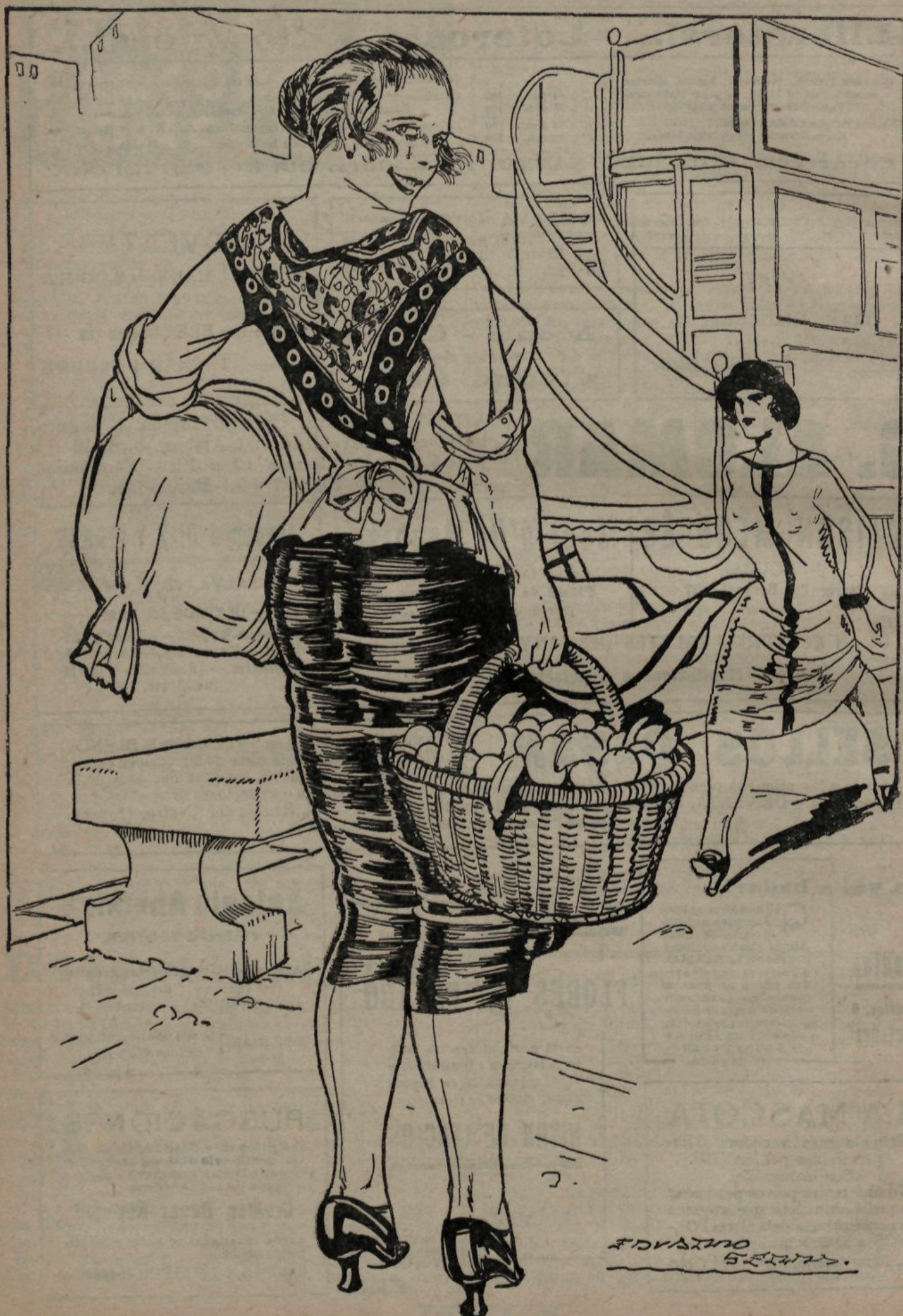
La Tuies: — No m'han deixat pujar a l'autobús perquè diu que porto bultos massa grossos. Si arriba a venir el meu home, no ens deixen ni passar pel carrer!