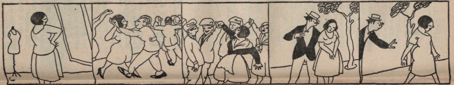
Con retazos recogidos se hace preciosos vestidos.