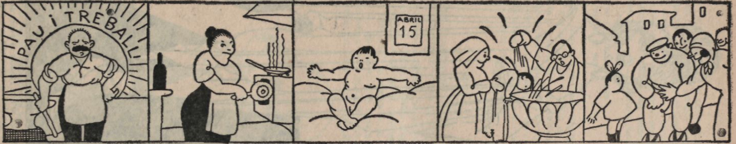
El padre, muy campetxano, es obrero del «Vulcano».