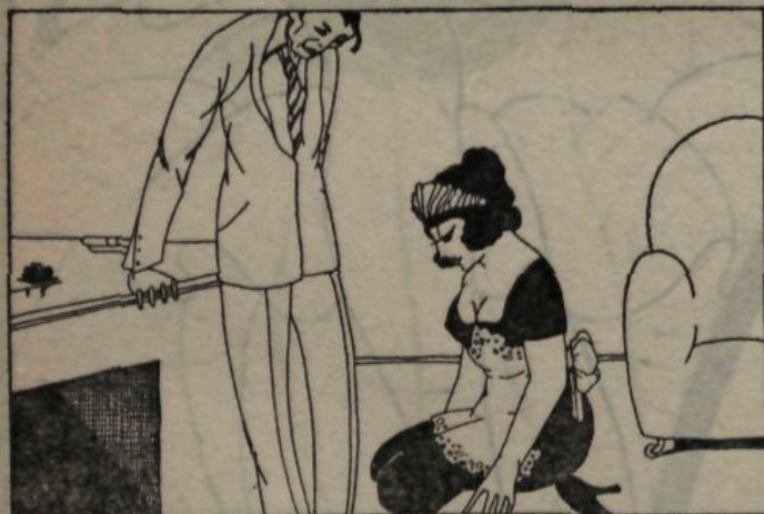
— Ah, dolenta! Això no es fa...