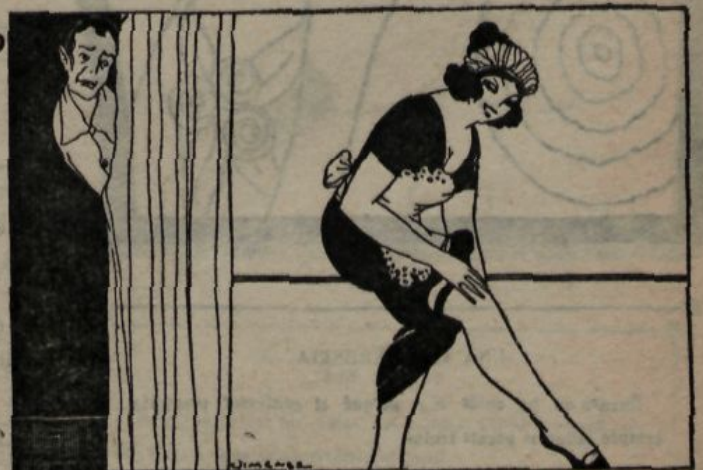
La Laieta s'arregiava una lligaçama...

El senyor Ramon féu un gest amb la mà indicant al masover que no volia cap explicació, folsà nerviosament el timbre, i aparegué amatent la Laieta esperant ordres.