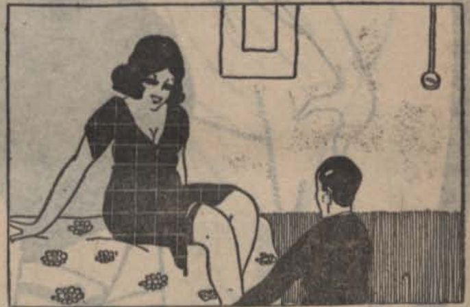
... no pogué resistir la temptació ...

Un escalfret d'engúnia somogué totes les fibres de la Laieta en pensar que si ella en tenia un de fill, no podria oferir-li ni llar, ni família, ni pare que l'estimés i li donés el nom perquè el portés amb orgull anys enllà i a través de la vida.