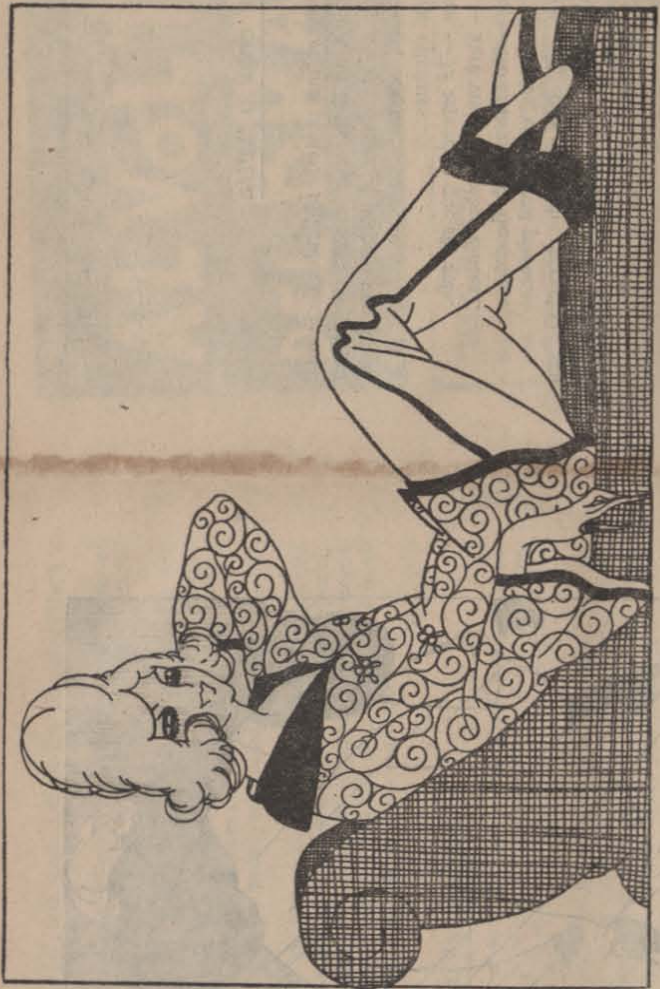
L'ART I LA DONA

L'ART I LA DONA J o sóc de Oratallons, encara que no ho sembli. Un dia, els meus pares em varen encarar amb pedra toca, un varen portar una cambleta nova i em varen facturar a servir a Barcelona. El senyor, em va encarar de mala manera, però jo després vaig entrar molts anys i tant veure que baixava de l'hort i tant-hi emparar get per lladre. Quan em vdrig donar compte de que servint ja no servia per criada nova i para... tota em vdrig llenar a l'uri, i, filla de Deu, quina pesca!... Ara, m'arranco per solistes amb la mateixa facilitat que abans arrancava naps. Qualsevol serveis i es lleva damunt i s'escarrosa per fer la neteja, podent entrar ben servida i tenint tot el llau les fèines! Res, nòs, que ató de l'art dona més i jo més; del paper que no s'ha de budar i pentre lo que es pagui!