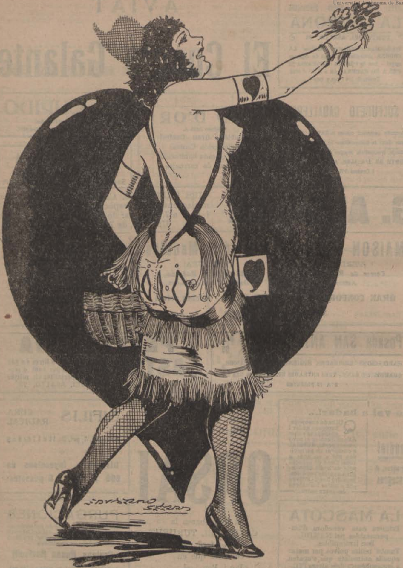
— Vaja, puc enorgullir-me del meu èxit en aquesta tombola. He tingut al meu darrera la flor dels joves concurrents!