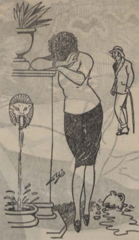
Final d'un poema d'una «notxa de verano».