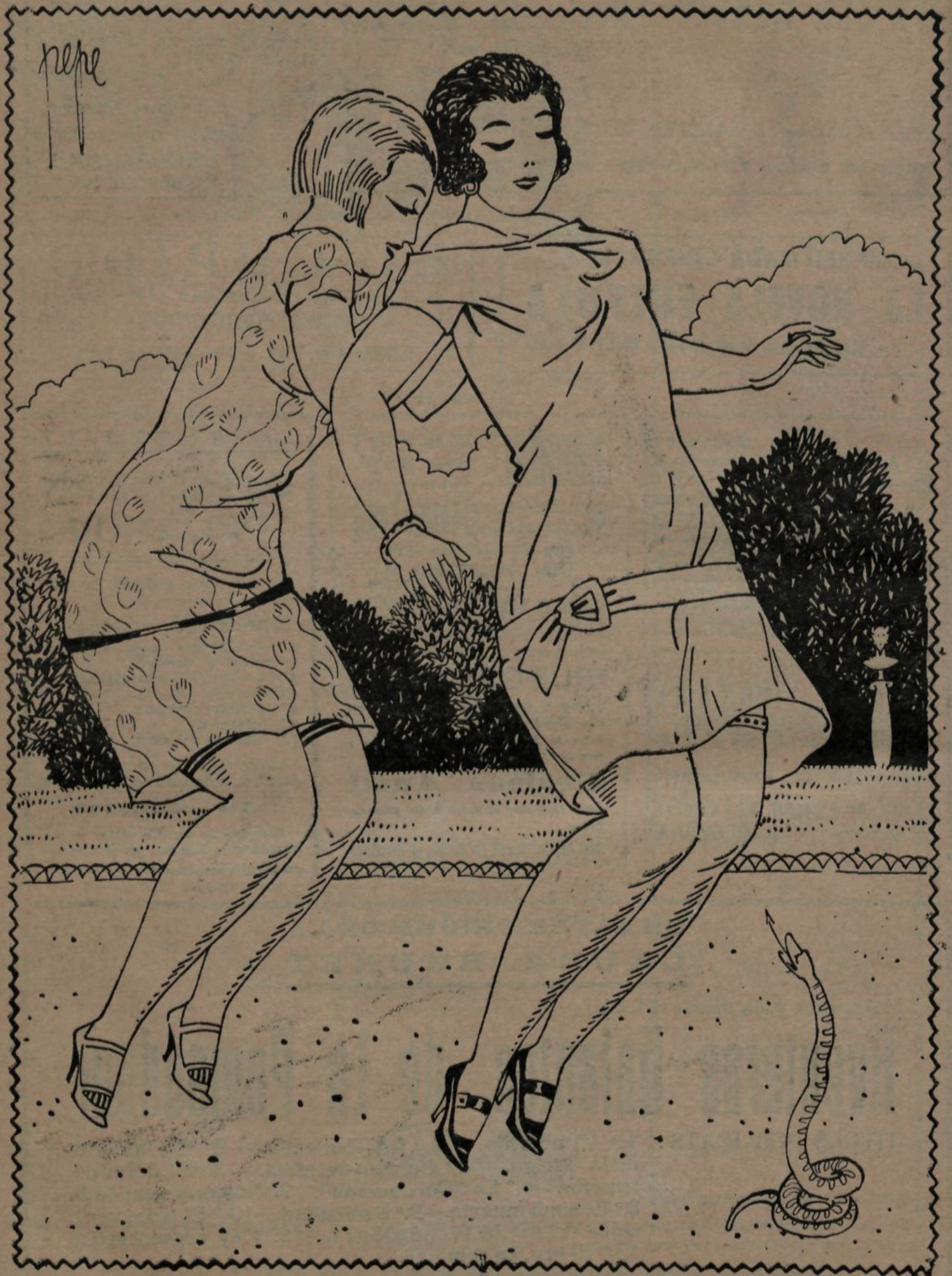
—Quin sust he tingut! Em creia que aquí hi havia un home enterrat!