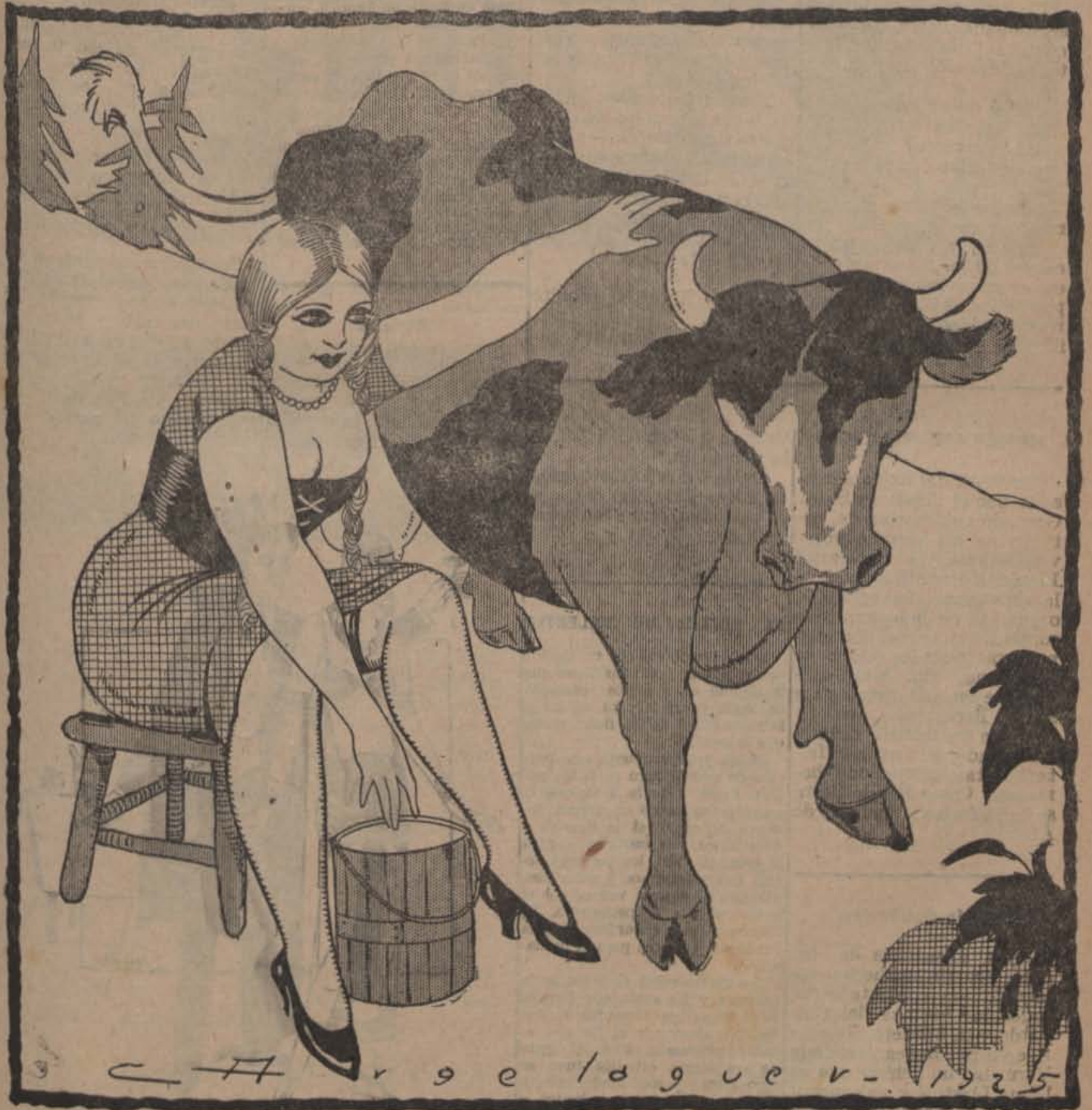
— Tòfol, Què mires? Fas uns ulls, com el toro quan veu la vaca!