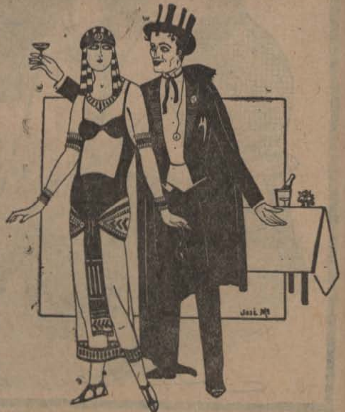
—Pues sí: m'ai disfresado de «Joven moderno» con capa. —Pues yo de capa-ritxo antiguo.

La película «Mirame y no me toques» ha sido fría y acogida por el público de esta ciudad, que la encuentra anticuada y llena de pre-