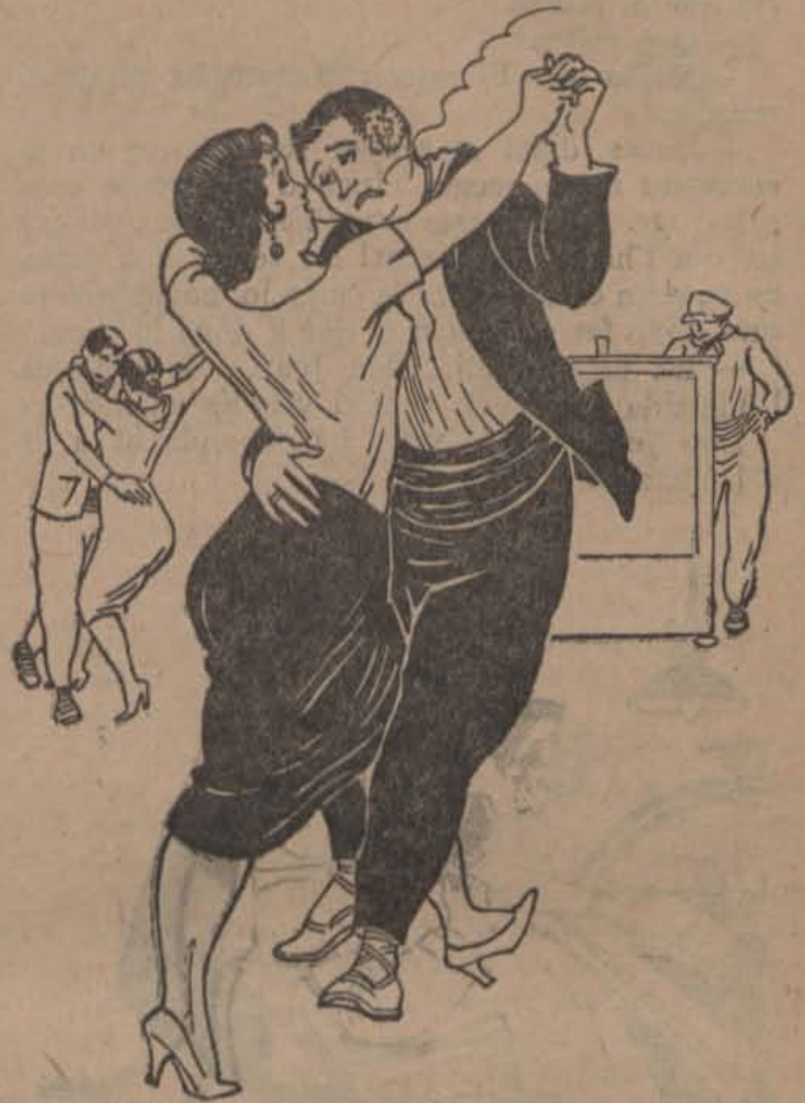
...quan cargolava aquelles massurques...

que tantes suors li havia costat. Però, què faria, si no treballava? Fer d'aristòcrata? Prou s'ho coneixia ell, que no servia. Divertir-se? Quan? A la seva edat? Què podia fer? Ell ja recordava