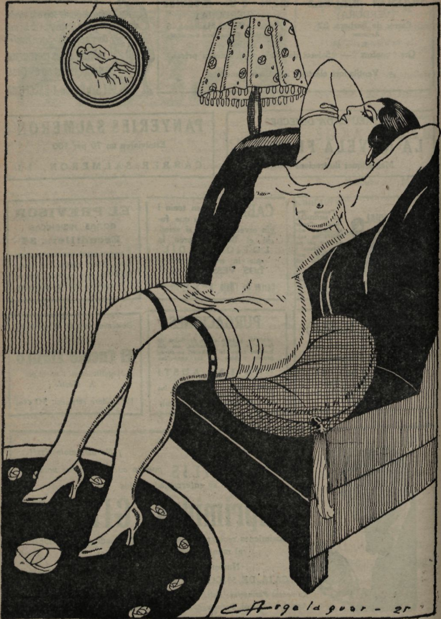
—Quines ganes tenia de passar un dia sen se rebre visites i descansar una miqueta!