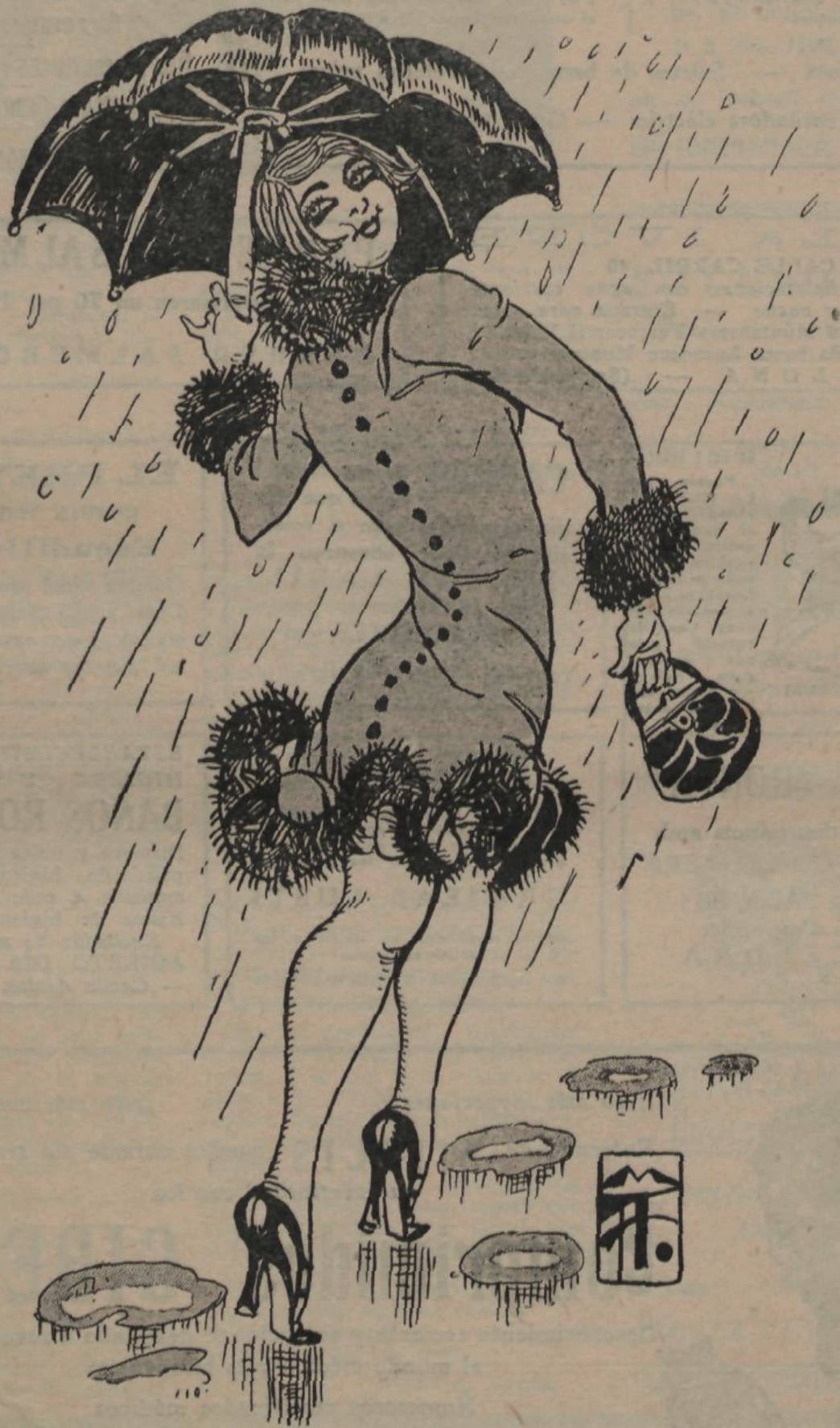
—Si els molesta la pluja, ja ho saben: visc aquí al cantó.