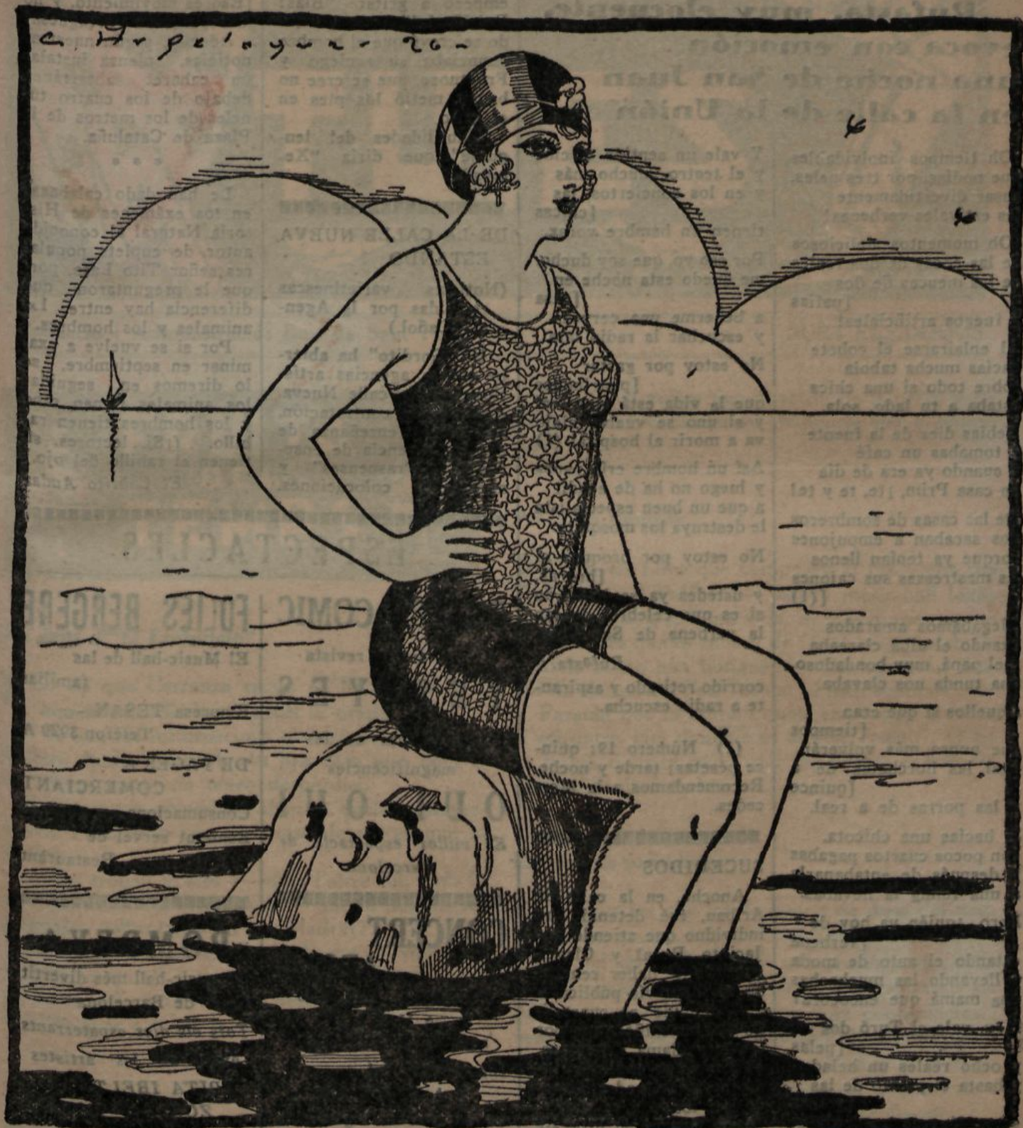
—Aquell nyicris del Kodak ja m'està empipant, cada dia, encara no em veu, ja me l'apunta.