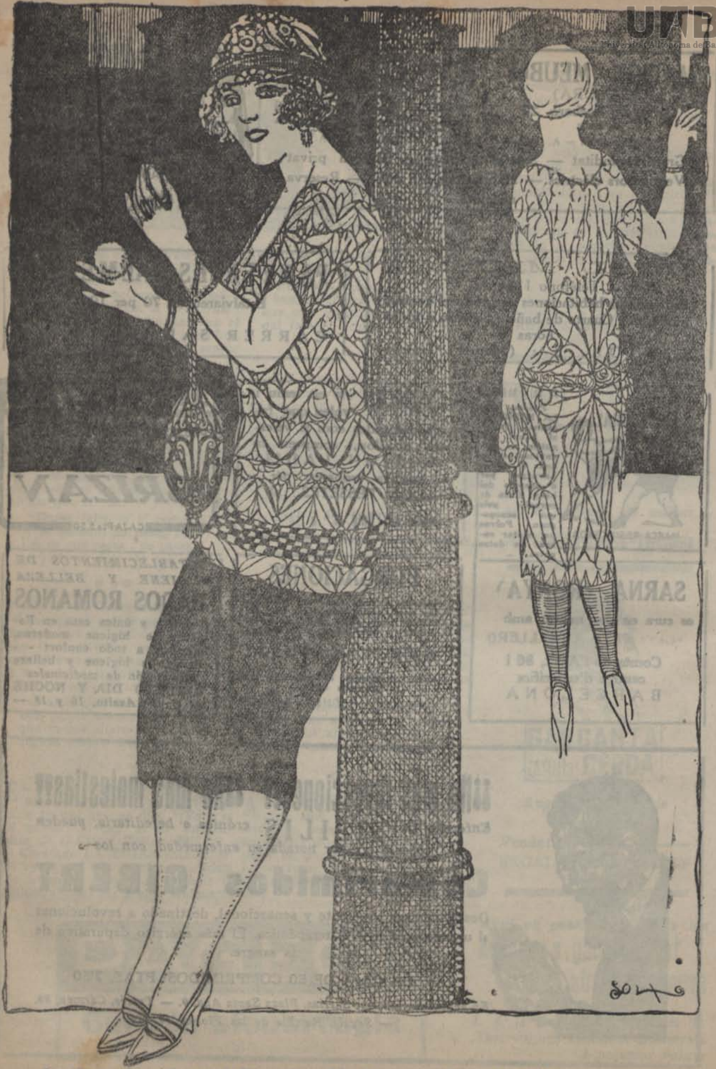
—Les dones són així: tots els llocs ens semblen bons per fer-nos la toaleta. .