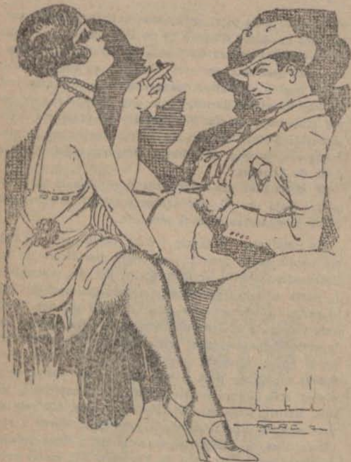
—No t'ho prenguis així, dona...

—Quina dona, senyor Bou, quina dona! D'això se'n diu fer conquestes!