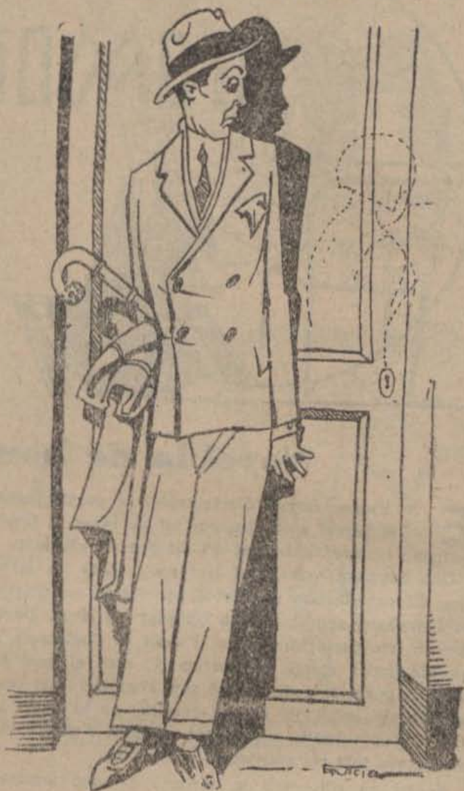
Va preferir no haver-se assabentat de res

alts de Pedralbes. I ell que es creia que havia tirat Muntaner avall, cap a la Plaça de Catalunya...!