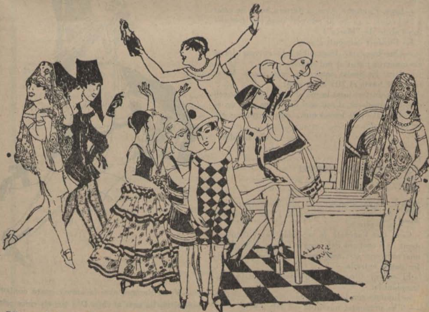
Diferents i divertits aspectes de les dones del nostre temps

Un dia, la dona d'en Ficandins, que era el crà-