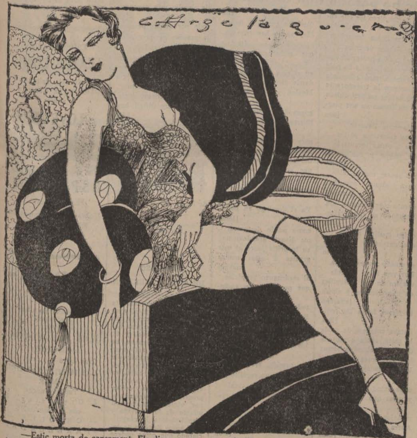
—Estic morta de cansament. Els dies que no surto a la "Revista", em quedo tota cruixida de tantes visites.