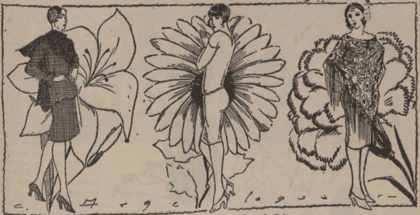
Heu's ací les flors que ens fan estimar la Primavera