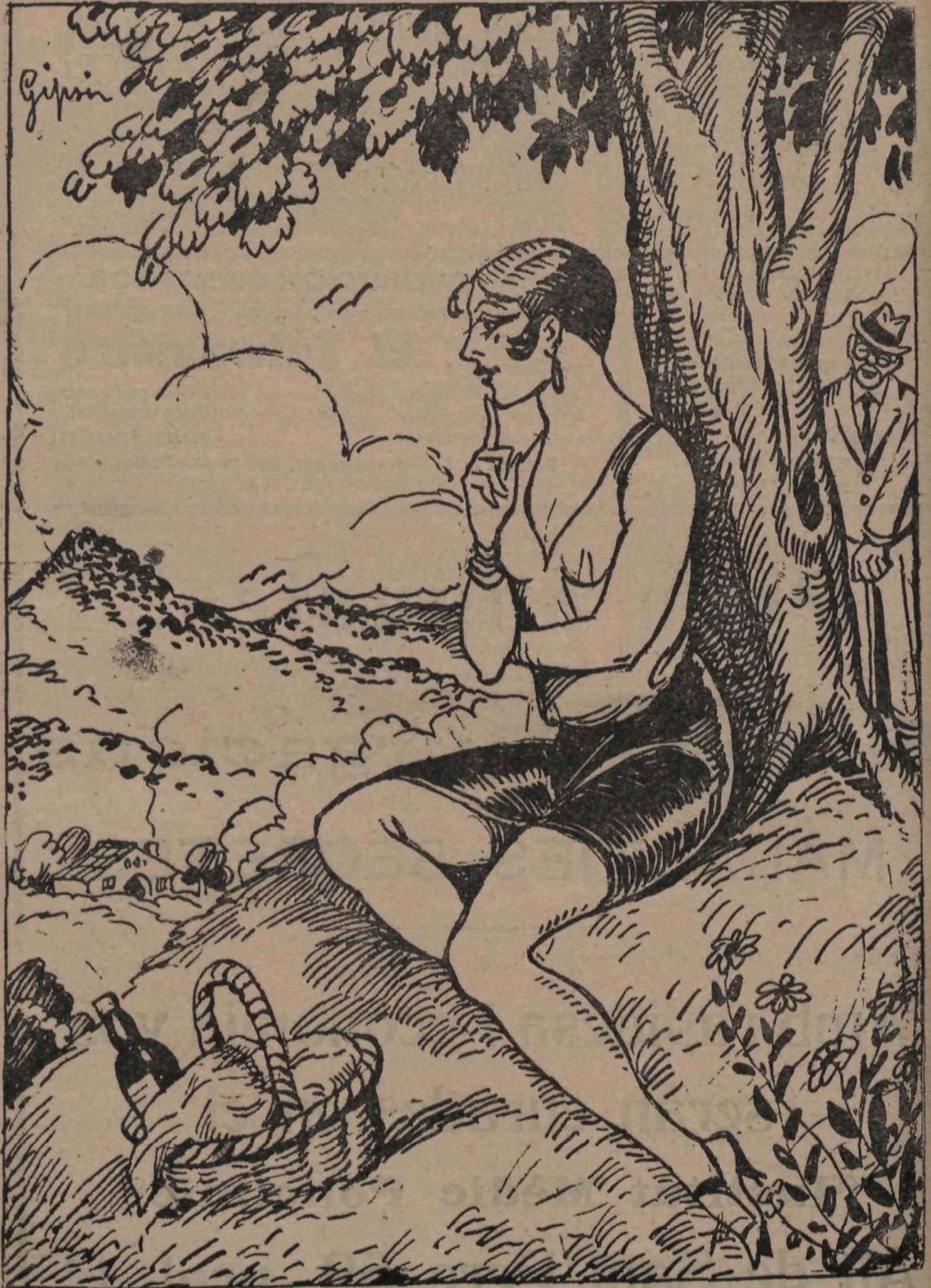
—A Barcelona, els "pagesos" em conviden a .mi, i jo aquí convido als pagesos.