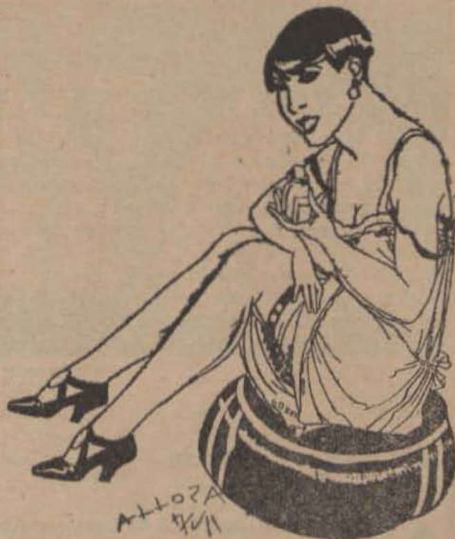
—Sembla mentida, una bona fricció d'essència, com fa rodar el cap als homes!

Però, no: en arribar a un lloc voltat de pins de la muntanya. L'auto parà. El taxi també. No