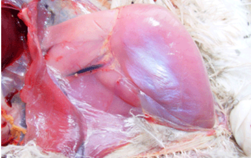
Imatge ventrodorsal de la pota esquerra d'un sisó afectat per miopatia de captura. Els músculs presenten un color molt pàl·lid.

04/2007 - Ciència Animal. La miopatia de captura causa lesions musculars molt greus als mamífers i a algunes aus salvatges, com a conseqüència de l'estrès que pateixen en veure's capturats. Un equip d'investigadors ha descrit ara per primera vegada aquesta malaltia en el sisó, un ocell present a les planes de Lleida, al qual han estudiat durant dos anys.