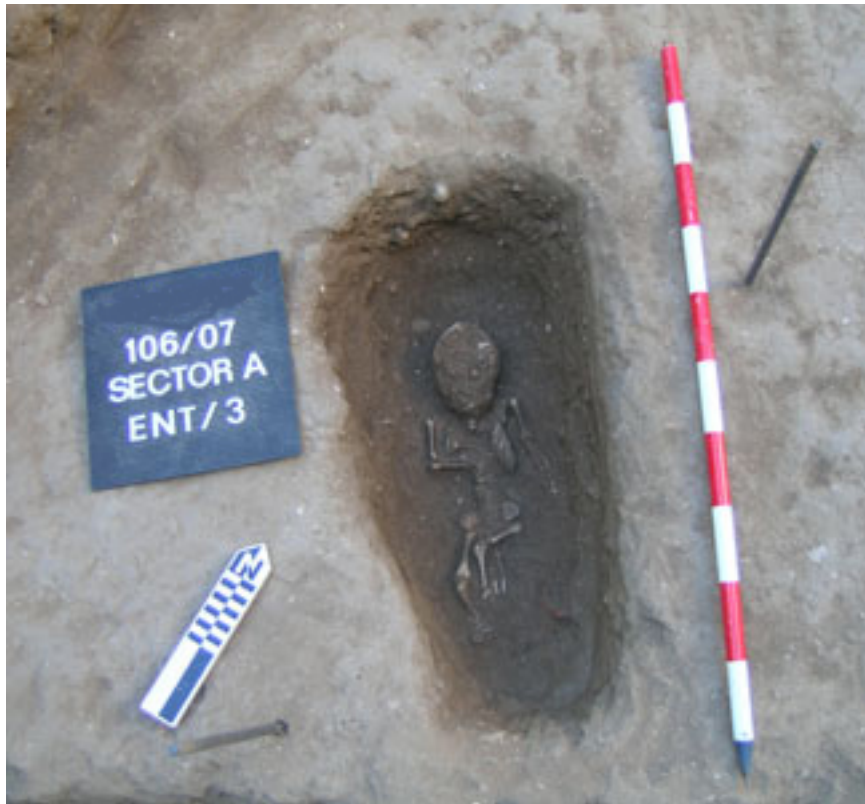
Esquelet d'un nen nouat.

02/2008 - Antropologia . Aquest treball defineix nous paràmetres que poden ser utilitzats en Antropologia Forense i Paleoantropologia per estudiar i definir l'edat, la salut i les condicions de vida de poblacions de temps passats. En concret, les autores han definit, mitjançant fórmules matemàtiques, el creixement de la zona isqueopúbica.