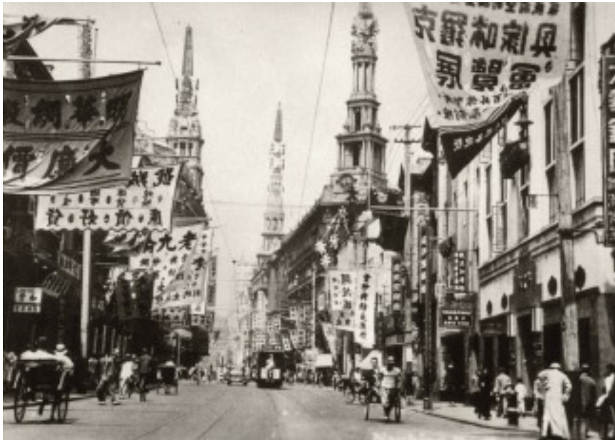
Vista de Shanghai, a la dècada de 1930, on transcorre una part de la història de la novel·la Weicheng (publicada el 1947).

#La recerca que presenta aquesta tesi doctoral aporta un nou enfocament als elements implicats en la traducció. Els resultats desafien la tradicional distinció entre elements lingüístics i elements culturals, a través de l'estudi de l'obra Weicheng , de l'escriptor xinès Qian Zhongshu (1910-1998), i de les traduccions al castellà i a l'anglès. La globalitat cultural d'aquesta novel·la i la seva riquesa literària posen de manifest que la traducció és quelcom més que una simple eina de commutació lingüística.