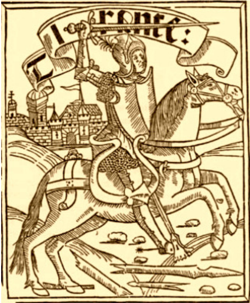
Tirant lo Blanc, un dels llibres més importants de la literatura universal i obra senyera de la literatura clàssica en llengua catalana.

Aquest treball s'emmarca dins els estudis que s'han fet sobre la situació de la recerca en filologia catalana. S'ha fet servir la bibliometria, recollint dades sobre el nombre de tesis doctorals, i utilitzant una eina d'anàlisi d'estructures socials. Els resultats mostren que, a partir de la dècada dels anys noranta i fins l'actualitat, el nombre de tesis doctorals d'aquest tipus ha disminuït considerablement i que hi ha una clara preferència per la literatura contemporània com a objecte d'estudi.