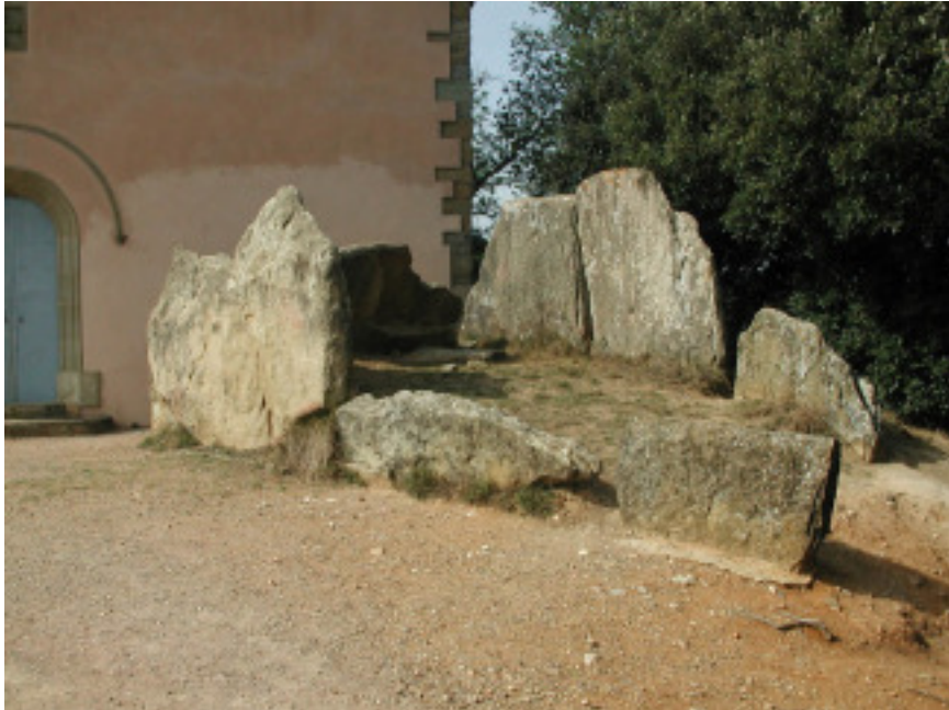
Foto del sepulcre megalític de Puigseslloses.

Una recerca interdisciplinària realitzada per investigadors de la UAB i d'altres universitats ha permès determinar de manera precisa la provenença de les lloses, de gran mida i pes, que conformen el sepulcre megalític de Puigseslloses (Folgueroles, Osona). Aquest megàlit, el més gran de la província de Barcelona, va ser construït i utilitzat com recinte funerari durant el III mil·lenni abans de la nostra era. Les dades aconseguides han permès conèixer l'important inversió de treball que s'hi va realitzar en el proveïment i transport de les lloses, esdevenint un exemple singular en el context del megalitisme a Catalunya i a l'Europa Occidental.