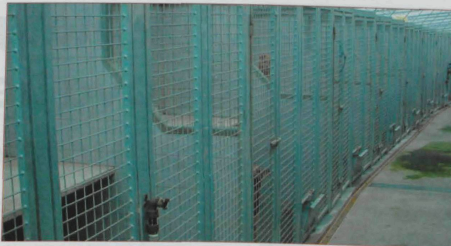
Les noves instal·lacions d'acolliment han permès millorar notablement les condicions de vida dels animals

Volem que aquest article també serveixi per acostar-vos una mica més a refugis com el CAAC i que en la vostra feina diària informeu als ciutadans que poden trobar un excel·lent company al CAAC. Si disposeu de medicaments o pinso a punt de caducar podeu fer una visita al