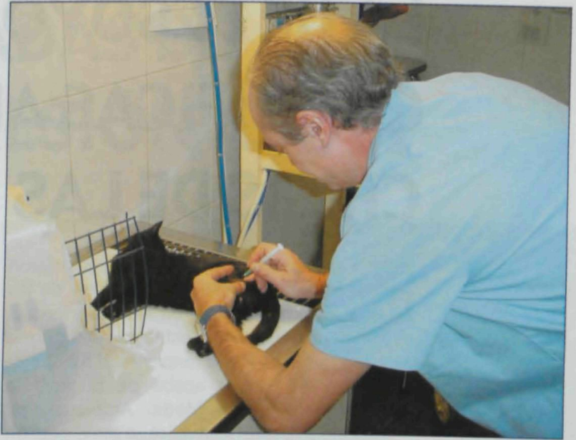
Periòdicament, els veïns responsables de les colònies de gats controlades capturen exemplars per comprovar el seu estat sanitari i esterilitzar-los a les clíniques col·laboradores.

La falta d'implicació de qui ens reclama és el que ens derrota. Intentem fer comprendre la gent que davant d'un animal amb problemes, no n'hi ha prou amb trucar a la protectora! Cal posar-hi de la nostra part. Les associacions tenim limitacions econòmiques i personals: no arribem a tot. Per això insistim a veure'ns cara a cara amb els qui ens truquen o ens