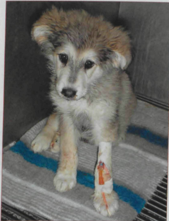
Un cadell de Husky recuperant-se d'una probable parvovirosi a la sala d'hospitalització

Les condicions al CAAC han millorat significativament i algunes de les nostres demandes s'han complert: el servei veterinari extern, contractat per concurs públic, està superant àmpliament els resultats dels serveis veterinaris anteriors; el nou horari de cap de setmana, que ha significat un augment important de les adopcions dels animals del centre; el servei de recollida d'animals perduts i accidentats, que ja ha començat a oferir un servei de 24 hores a Barcelona. Podeu conèixer més detalladament l'esforç realitzat