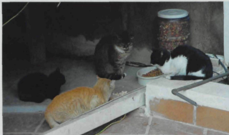
Els gats que mengen pinso tenen molt més bon aspecte que els que mengen restes.

Els veïns solen tenir un alt grau de desconeixement sobre totes aquestes gestions. Els expliquem que