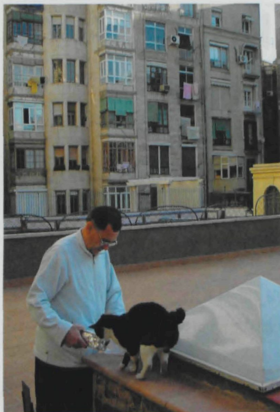
La col·laboració dels veïns és imprescindible per controlar les colònies urbanes de gats. A les imatges del reportatge, gats d'una mançana de l'Eixample barceloní