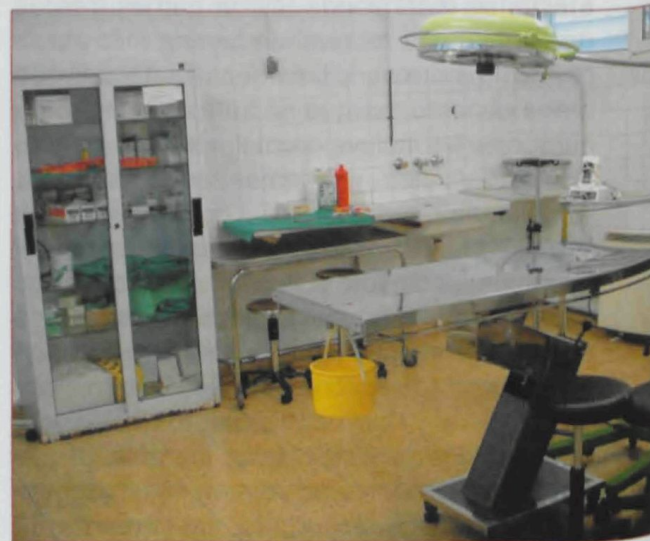
Aspecte del nou quiròfan

E n els quasi dos anys que portem al capdavant del Col·legi de Veterinaris de Barcelona hem sofert l'escassa o nul·la prioritat que per algunes administracions ocupa la qüestió de l'animal de companyia, així com la fàcil demagogia d'algunes associacions protectores tradicionalment lligades al discurs populista i poc realista. Creiem, però, que el treball conjunt amb algunes persones i institucions més destacades pels seus objectius comuns, està portant alguns dels resultats que esperem: el "Programa d'Atenció Local d'Animals de Companyia" de la Diputació de Barcelona, liderat per la Diputada Margarida Dordella; el decret d'eutanàsies i les campanyes de sensibilització sobre tinença responsable realitzades per la Direcció del Medi Natural de la Generalitat, com a mostra de les nombroses tasques que recauen en la infatigable Cristina Giner; la taula interadministrativa en la que hem aconseguit superar algunes diferències polítiques per poder discutir junts amb diferents administracions solucions a temes tant complexos com la ineficàcia llei de nuclis zoològics o la