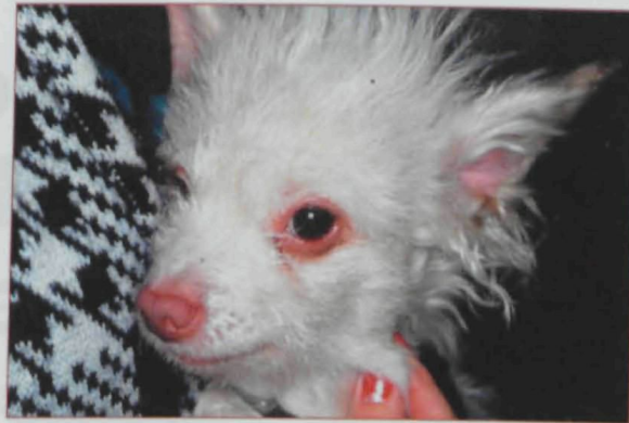
Blefaritis y eritema en el pabellón auricular externo.

No existe unanimidad acerca de la eficacia de estas dietas de nueva aparición. Cualquier dieta que se elija hay que aplicarla de forma gradual (mezclarla durante 3-4 días). Es muy importante concienciar al pro-