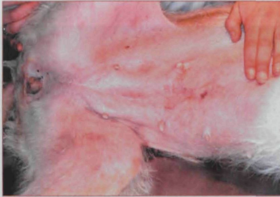
Eritema en la región inguinal en un perro con alergia alimentaria.

co puede agravarse coincidiendo con factores estacionales como la proliferación del polen o las pulgas con la llegada del buen tiempo.