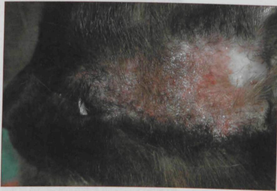
Intenso eritema, exudación y excoriación en la zona preauricular de un gato con una reacción adversa a los alimentos.

Cuando se realiza una dieta de eliminación, la mayoría de perros con alergia alimentaria tienen infecciones bacterianas secundarias. Un antibiótico muy frecuente son las cefalosporinas en cápsulas. La línea más ortodoxa