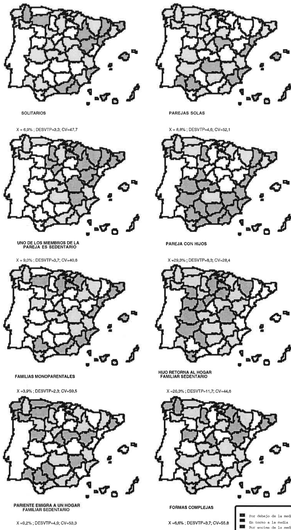
Mapa 2.- Proporción del tipo familiar de migración de jóvenes entre provincias según la provincia de destino en 1991