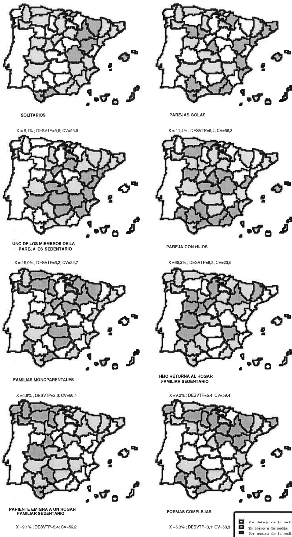
Mapa 3.- Proporción del tipo familiar de migración intraprovincial de jóvenes