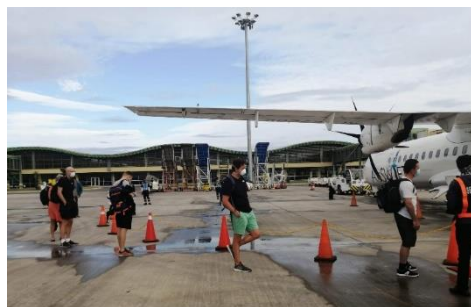
Vuelos de repatriación

En el marco de la estrategia para hacer frente al coronavirus, la vocación global de la UE se materializó en la puesta en marcha, el 8 de abril, del programa Team Europe , con una dotación inicial de 20.000 millones de euros, cifra que ascendería posteriormente hasta los 38.000 millones de euros. El programa nació para ayudar a luchar contra la pandemia en los países más vulnerables , principalmente en zonas del Este de Europa, África, Asia y Pacífico, América Latina y Caribe. La financiación del paquete combina recursos propios