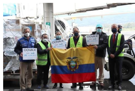
Primera entrega de vacunas COVAX en Ecuador