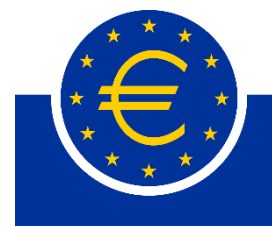
Logo del BCE

Ante la extensión mundial de la pandemia, el 18 de marzo, el Banco Central Europeo lanzó un programa temporal de compra de activos de valores del sector público y privado ( PEPP ), dotado de 750 mil millones de euros. La intención del BCE fue hacer frente y absorber el choque económico en Europa, ya situada como epicentro de la pandemia y con casi una decena de países en confinamiento total o parcial de su población y con la consecuente afectación al sector económico. El PEPP incrementó su presupuesto hasta en 3 ocasiones durante el año 2020. En junio se ampliaron los estímulos con 600.000 millones a la dotación inicial y en diciembre, se destinaron 500.000 millones más.