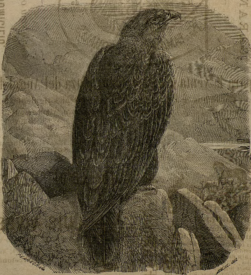
El Aguila Real.

En la vecina villa de Gracia continúa expidiéndose la carne de carnero á 18 cuartos la tercia; mientras que en Barcelona no se ha alterado el escandaloso precio de 26 cuartos. Por mas que incurramos en el enojo de cierta clase de personas, no podemos prescindir de llamar la atención de quien corresponde, sobre tan enorme diferencia, así como no cesaremos de hablar de este asunto, y de indicar al propio tiempo la procedencia del mal y los medios de corregirlo, sin que nos hagan cejar en nuestro propósito ni nos hagan guardar silencio los anónimos ni amenazas de ningún género.