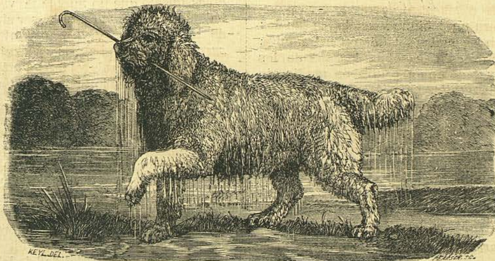
Perro de aguas.